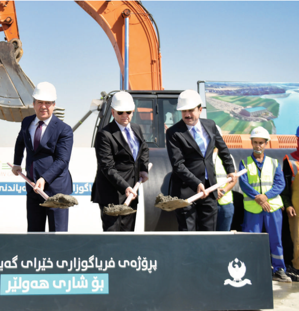
پروژەى فریاگوزارى خیرای گه بو شارى هولیر

گۆپرانکارییه نەرئینیهکانی کەشوههوا و کەمبۆنەهەى ئاوی سەر زەوی و ژێر زەوی و وشکەسالی لە مەترسیدارتیرین تەحەددییەکانی بەردەم مەرۆفایەتی و ولاتانە و کاریگەریی زۆر خراپی لەسەر کەمبۆنەهەى ئاوی خواردنەوه و کشتوکال و ئازەلدارى و پیسبۆنی ژینگە و سەرچەم سێکتەرەکانی دیکەى ئابووری و گەشتیاریش هەیه. لەخۆرا نەیانوتوو، «ئاو و ئاوەدانى». لەم چوار سالەى رابردوودا حکومەتى هەرێمى کوردستان و مەسرور بارزانى سەرۆکی حکومەتى هەرێمى کوردستان گرنگییەکی زۆریان بە دروستکردنی بەنداو و پۆندەکان داوه. هەرچەندە بەنداوهکان بە پروژەى گەوره و ستراتیژی دادەنرێن و بودجه و پارهیەکی زۆری پێویستە، بەلام قەیرانی دارایی رینگ نەبۆوه لەبەردەم ئەنجامدانى ئەم جۆره پروژەیانە. گۆفاری گولان لەسەر ئەم پرسە و جیبەجێکردنی پروژەى بەنداو و پۆندەکان دیداریکی لەگەڵ دکتۆر کاروان سەباح هەورامى بەرپۆبەهرى گشتی سەرچاوهکانى ئاو لە وهزارەتى کشتوکال و سەرچاوهکانى ئاو ساز دا.