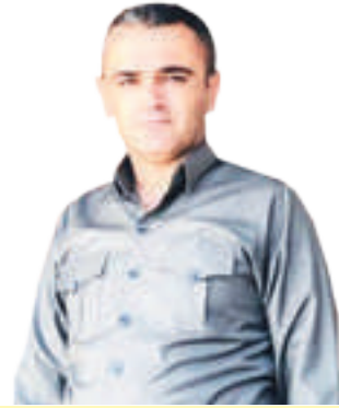
ھندرىن عەولە مستەفا كۆپى شەھىد:

ئىمەى كۆپى شەھىد و خانەوادەى شەھىدان دەنگمان بۆ پارتى و سەرۆك بارزانبىيە، پىمان وايە تاكە حزبى نەتەوئەكەى خۆى بە خاوەنى دۆزى رەواى كورد دەزانى، تاكە حزبە نەك لەسەر ئاستى كوردستان بەلكو لەسەر ئاستى ھەموو عىراق كە خاوەنى سەرۆك و سەرکردەيەكە لە ناوچەكە و لە جىھانىش ناسراو و حىسابى تايەتى بۆ راو قسەكانى دەكرىت، پارتى ديموكراتى كوردستان حزبىكە خاوەنى دەيان دەستكەوتى مېژووئىيە بۆ نەتەوئەكەمان، خاوەنى بونىاتنانى كابينە يەك لەدواى يەكەكانى حكومەتى ھەرئىمى كوردستان، پارتى ديموكراتى كوردستان تاكە حزبە ئىش لەسەر دۆزى كورد دەكات لەھەرچوار پارچەى كوردستان و ھەولنى يەك ھەلۆئىستى و كۆدەنگى سەرچەم حزبەكان دەدات لە پىناو نەتەوئەكەمان.