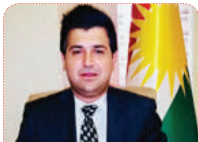
مه مه د عه لی یونس:

میژووی خه باتی سیاسی پارتی ديموکراتی کوردستان له پیناو به ده سته پنیانی مافی ره وای گه لی کوردستان و، پرنسيپ و ریکخستنیکي توکمه، وایکردوه که زورینه ی هاوولاتیانی کوردستان له کاتی هه لېژاردنی نوينه رانیاندا، کانديده کانی پارتی ديموکراتی کوردستان هه لېژن، سازشنه کردن له پیناو مافه کانی گه لی کوردستان و دروستکردنی کيانیکی به هيز بو هاوونيشتمانیان، هه ميشه خه می گه وری سه روک بارزانی بووه، جيا له مانه ش حزبيک که له سه ره تاي دامه زاندينه وه سه ره وای چهندين گه له کو مکی نیو خویي و هه ریمی و نیوده ولته تی و، بهر زراگرتنی نالای کوردستان و پاراستنی له هه سوو ده ستيکی دوژمنکارانه، وایکردوه خه لک به وپه ری