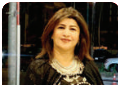
تاقگە عومەر رەشید:

یڤگومان ھەلبژاردن پڕۆسەىەكى دیموکراسیەى لە عێراق و، بەشداریکردنمان بۆ بەھێزکردنى پینگەى کوردە، چەندە کاندیدی پارتى لە بەغدا بەھێز بێت، پینگەى کورد بە ھێزتر دەبێت، چونکە پارتى دیموکراتى کوردستان پارێزەر و داكۆکیکارە لە پرسی نەتەوەى و نیشتمانىیەکان، بۆ پاراستنى قەوارەى ھەریەى کوردستان دەنگ بە پارتى دیموکراتى کوردستان دەدەم، ھەرۆھا پارتى ھەمیشە داكۆکیکارى سەرەخستى پرسی ئافرتە لە نیو کۆمەلگە و کایەى سیاسیدا، ھەمیشە