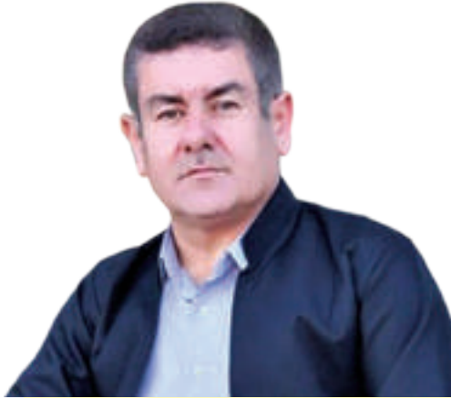
ھېرش غەرىپ بىراى شەھىد: