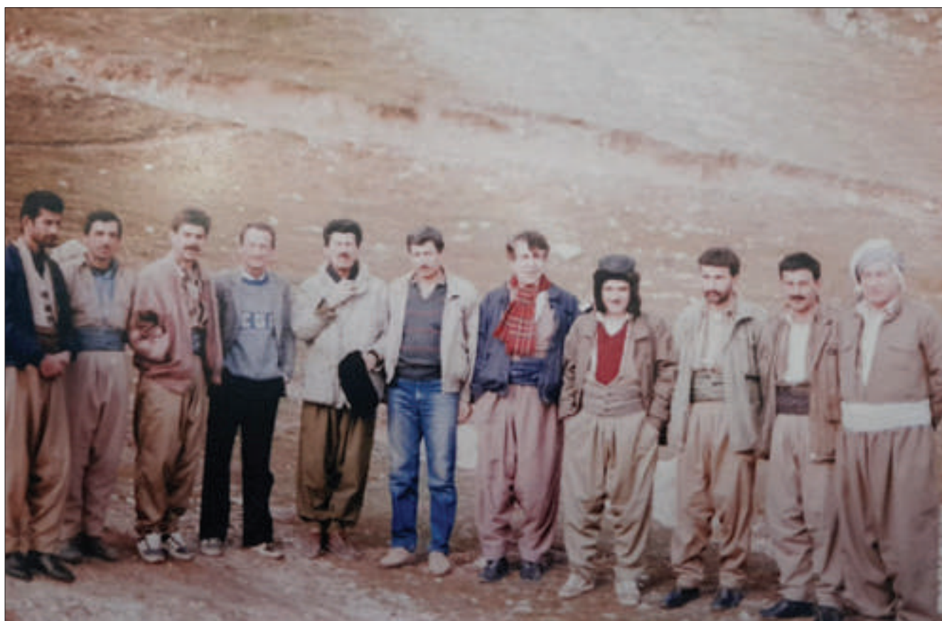
هەفائ ئازاد بەرواری له گەڵ کارمەندانی دەنگی کوردستاندا