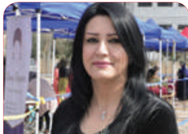
پهيمان ته ها: