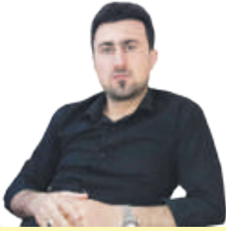
ئاراز جەوھەر كۆپى شەھىد: