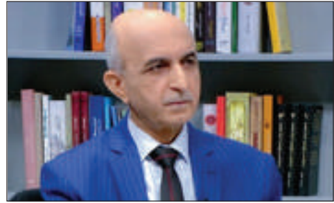
عه بدولرهحمان سدیق

گەر دهتهوێت یاسایهکی شهفافی نهوت و گاز له عێراقدا دهههچیت، دهنگ به کاندیدانی پارتی بدەن