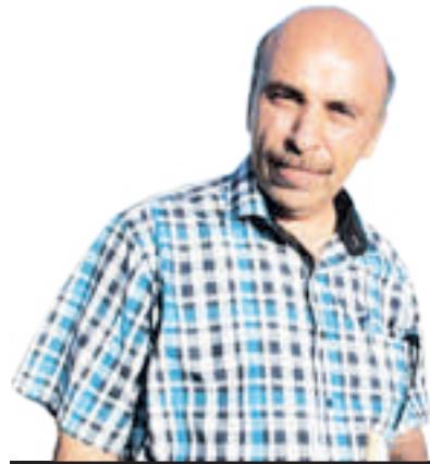
شارهزا و پەخنە گر لە بواری سینەما ھونەرمەند بشتیوان عەبدوللا: