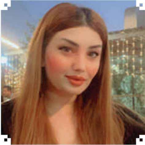
راژان ستونى چالاكى مەدەنى: