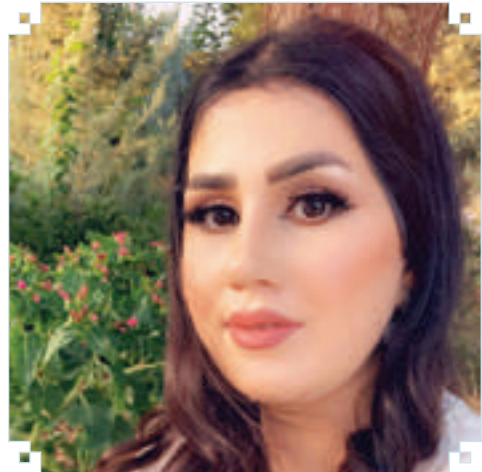
ھیشوو دارا سالج بەرپرسی ئەنجومەنى دەورو بەرى سلیمانى (ی.ئا.ک)