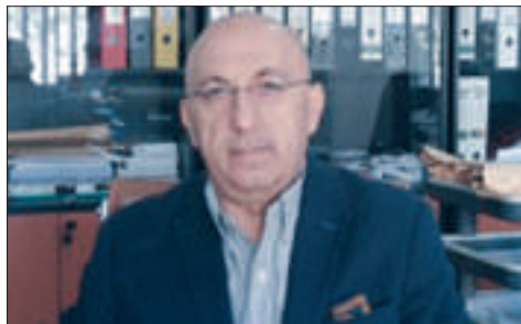
پروفیسور دانا خدر مهولود

ئەندامی بۆردی زانکۆی کوردستان- ههولیر سه‌رۆکی به‌شی شارستانی/کۆلیژی ئەندازیاری/ زانکۆی سه‌لاحه‌ددین بۆ گولان ده‌ینوسییت