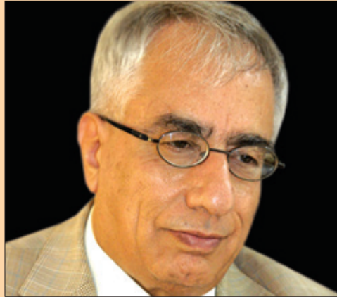
پ.د. شيرزاد نهجار تاييەت بۇ گولان نووسيو يەتى

يەككە ئەخسەلەتە سەرەككەيەكانى كۆمەلگەي باش بريتىيە ئە بوونى ئەخلاق كە داوا ئە تاكەكەس، يان تاكەكەسەكان دەكات، كە بە شيوەي كۆمەل رەفتار بەن