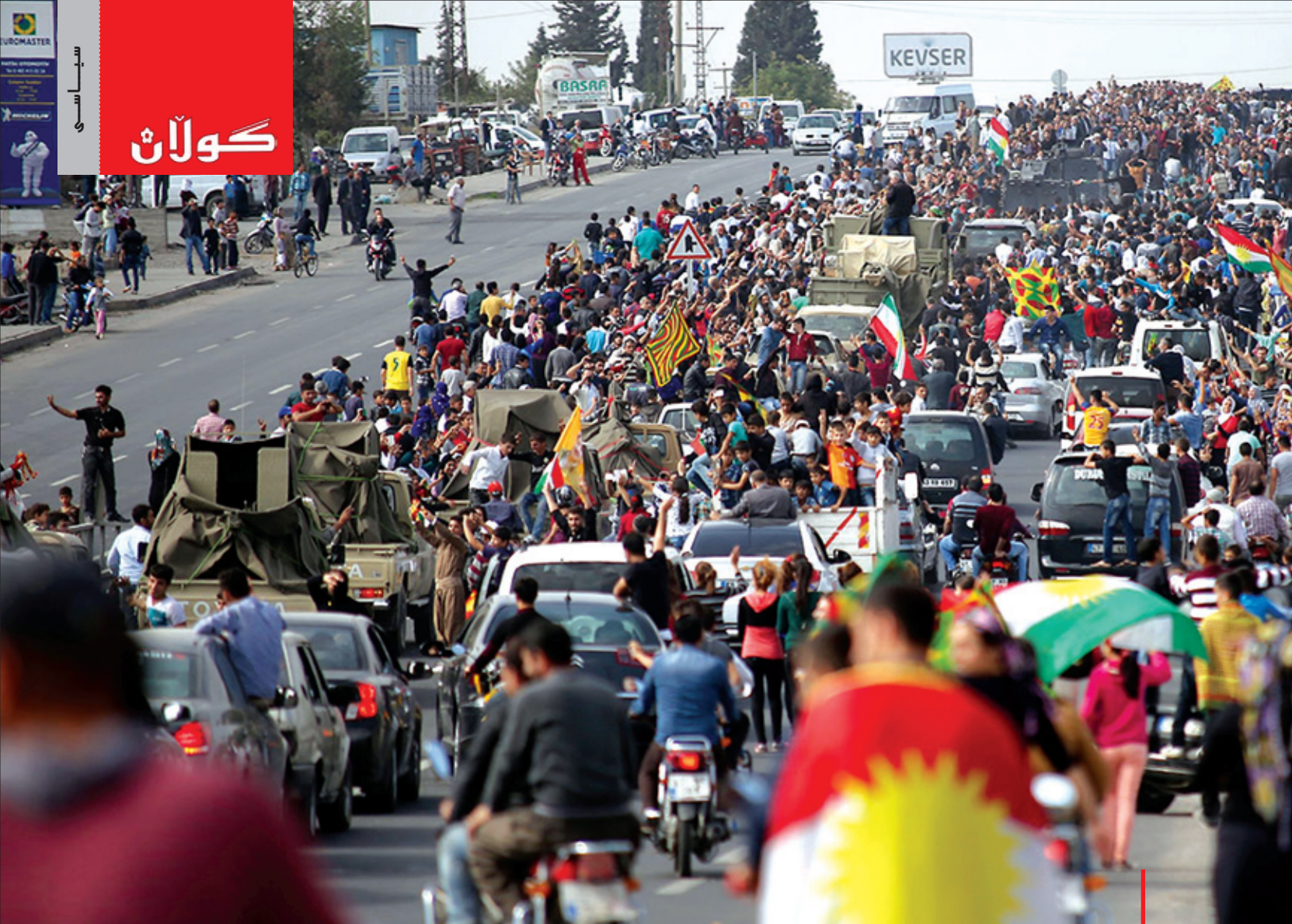
پیشوازی باکوری کوردستان له هیژی پشمرگه له کاتی تیپه رپوونی بو کۆبانج

هه ندى ره چاوى ئەمريكاو دۆخى ناوچه كەش بكات، بڵين باشه، چونكه ئەمجاره له عێراقدا به واقیعی دەرکەوت به شدارى كورد له عێراقدا به شدارى نىبه و شهراکەتیش نىبه، كورد داواى له عەبادى كرد نىبو سەعات وتارخویندنه وهى خۆى دوا بخات، كه چى دواى نهخست و حكومه تى خۆى پێكهێنا و بهرنامهى خۆى پشكەش كرد، تهنا ته نەندامانى پەرله مان شتيكيان خویندوه له ناو پەرله مان، كهس گويى بۆ نه گرتن له بهغدا، واتا ئەمجاره كورد له عێراقدا شهريك نىبه و له ترسى شهرى داعش سوننهيان هینا كردهانه ئەلتهرنا تىف، نو وهزاره تيان پيدا ون و سهروكى پەرله مان و جينگره كانى سهروك وهزيران و سهروك كۆماریان داوته، كه چى دوو سى وهزاره تيان بۆ كورد داناوه دواى مانگ و نىويك كه دهچين به شدارى دهكەين، پیمان دهلین به شتيكتان پى ددهين و به شداريتان پى دهكەين، ئەگينا كورد ئیستا له عێراق شهريك نىبه، شهراکەت ئەوه بوو كه جارى پيشوو هاتن له ههولير دانىشتن كه چۆن دهسلالات دابهش بكەن له عێراقدا، ئەوه شهراکەت بوو، ئیستا كورد له عێراقدا پهراوێز خراوه.