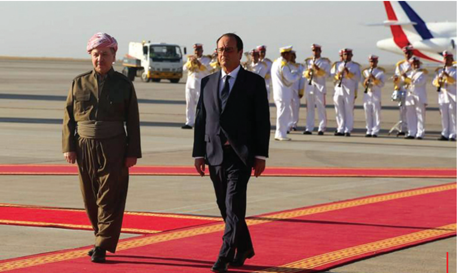
هەولێر - سەرۆکی کوردستان لە پێشوازی سەرۆکی فەرەنسادا

لەو دەداوەیە کە کورد لە رووی دیپلۆماسیەت و پێوەندیەکانی دەرەویدا سەرکەوتنی بە دەست هێناوە، تەماشای ژمارە ناکرێت، چەند پێشمەرگەیی باشووری کوردستان بە ناو سێ سەد کیلۆمەتری ولاتیکی دیکەدا کە ناوی تورکیایە و چەند سالیکی پێش ئێستا هەر برۆی بە ناوی کوردیش نەبوو، ئەمە وەرچەرخانیکی زۆر گەورەیه رەنگە تورکیا ئەمە بۆ خاوەکردنەوی فشاری ئەمریکا بکات، بەلام دیپلۆماسیەتی کورد و ئەمریکا و کوردو تورکیا گەشتۆتە ئەو ئاستەیی کە پێشمەرگە بە چەکی قورسەووە لە هەولێرەووە روو بکاتە سنووری زاخۆ و لەوێوەش سێ سەد کیلۆمەتر بە ناو خاکی تورکیادا برۆات بۆ بەهاناوچوونی براکانی لە پارچەیهکی دیکەیی کوردستان، رەتبوونی پێشمەرگە لە کوردستانی عێراق بۆ کوردستانی تورکیا و گەشتنەووەی بە کوردستانی سووریا بایەخێکی گەورەیی میژوویی هەیە، ئەمە خەوێنکە چاوەڕواننەکراو بوو، هەنگاویکی سەرکەوتنە کە لە هیچ کتێبێکی گەورەیه کە جێی ناییتەووە، هێزی پێشمەرگەیی کوردستان وەک هێزێکی مەعنەوی و سەربازی بۆ بەدەمەووە چوونی براکانی لە کۆبانی خاکی دەولەتی دیکەیی بریووە، تەنیا لە سەر ئاستی هێزە