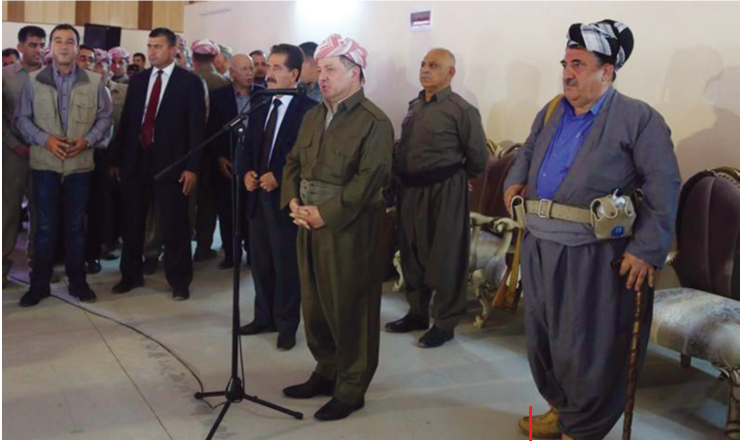
سەردانى سەرۆكى كوردستان بۆ ميخوهرى كەركوك

كرد، ھاوكارى مرقىي و سەربازى و چەك بەدن بە كوردستان، ئىمە تا دوئىي فېشەكىمان بە قاچاغىش دەست نەدەكەوت، ئىستا فرۆكەى سەربازى زلھىزانى دنيا لە ھەولير چەك دادەبەزىنن بۆ پېشمەرگە، بە ئاشكرا دەولەتان دانەنن بە ھەوى ھاوكارى كوردو پېشمەرگە دەكەن، ئەمە سەركەوتنى گەورە، يان چوونى پېشمەرگە لەم رۆژانەدا بە ئاشكرا بۆ پارچەيەكى دىكەى كوردستان و بە رېرەوئىكى فەرمى نۆدەولەتى ئەمانە ھەمووى خەونە ھاتوونەتەدى.