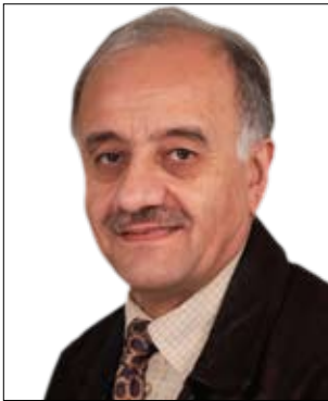
پ. جہمال رہسول محہمہ دئہمین*