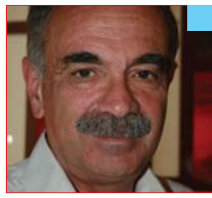
پروفېسۇر مېشىل فىقھىئوركا *