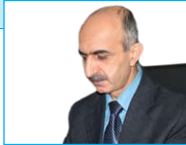
عه بدولره حمان سدیق

سامی ئه لعه سکهری سیاسه توانی عه ره بی شیعوه و په رله ماتتاری پیشووی عیراق، له توری (عراق القانون) له بهرواری ۵۰ ئه یلوولی ئه مسالداو له ژیرئهم ناونیشانده بابته تیکی له دوو ئه لقه دا نووسیوه، ئه مه ی ده یخه مه بهر دیده تسان ناوهرۆکی ئه و خالانه یه که په یوه ستن به ئاینده ی کورد و عیراقه وه.