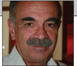
پروفیسور میثیل فیثورکا *