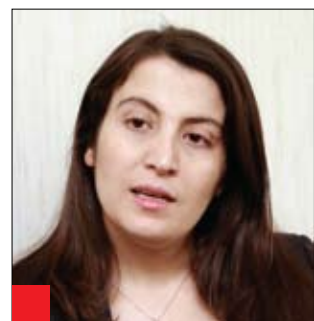
پەرلەماتتار نامىنە زكرى:

ئافرىتى كورد لە رۆژانى تەنگانەدا تەنيا بە پەرورەدەكردنى مندال خۆى گىرۆدە نەكردوو ە ھەردەم لە شىواز و جۆرەكانى خەباتدا رۆلى بەرچاوى ھەبوو