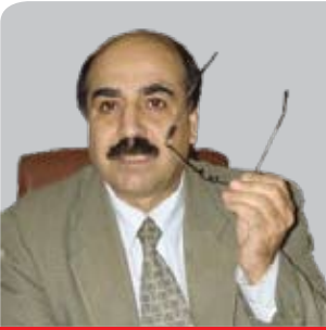
فەرىد ئەسەسەرد بۇ گولان دەپنوسىت

بە ھەر حال، پاش مشتومپىكى توند و گەرم و گور كە دوورايەكى كۆمەلايەتتى وەرگرت بوو، پاشا فوناد بە شىوہەكى كتوپرو پىشسىنى نەكراو لە وەرگرتنى خەلەفت پەشىمان بۆو. سەرچاوەكانى ئاماژەى روونيان بۇ ھۆيەكانى پەشىمان بوونەوہى نىيە، بەلام دەش برىتانبا لە چوارچووى دىپلوماسىيەتە نەبىيەكەيدا سەرکەوتو بوو پى لە پەشىمان كرنەوہى، بەلام يەكەك لە گەورەرتىن كاردانەوہكانى دژ بە ھەلۆھشاننەوہى خەلەفتى عوسمانى، لە سالى ۱۹۲۸دا دەبىندىرئ، كاتىك حەسەن بەننا لە شارى ئىسماعىليە كۆمەلەى ئىخوان مووسلمىنى دامەزراند. ئەم رىكخراوہ كە لە سالانى دوواتردا كارىگەرىيەكى زۆرى لە سەر سىياسەتى ناوخۇبى و ھەلسورانى كۆمەلايەتى دەبى، تەنھا پاش چوار سال لە ھەلۆھشاننەوہى خەلەفت سەرى ھەلدا. بە دلنبايەوہ ئەگەر خەلەفت لە توركىا ھەلۆھشىندرايەتتەوہ، رىكخراوى ئىخوان مووسلمىن لە مىسر دانەدەمەزرا ياخود لانى كەم زۆر دەرەنگ، لە سالانى چلەكان و پەنجاكاندا، دادەمەزرا.