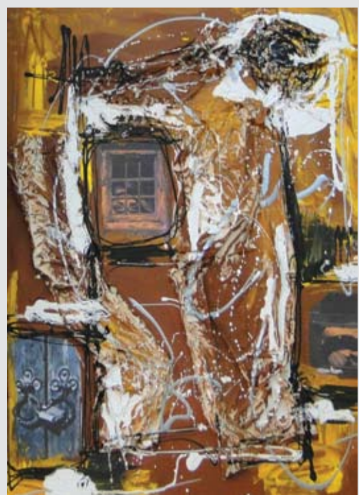
- تابلۆى خانو

تىبايدا چەند پەنچەرەبەك بە دەست رەنگىنى ئەو خاتوونە كارى بۇ كراۋە، لە خوارەۋەش ئامازەى بە دەرگايەكى قوفل كراۋ كرودوۋە.