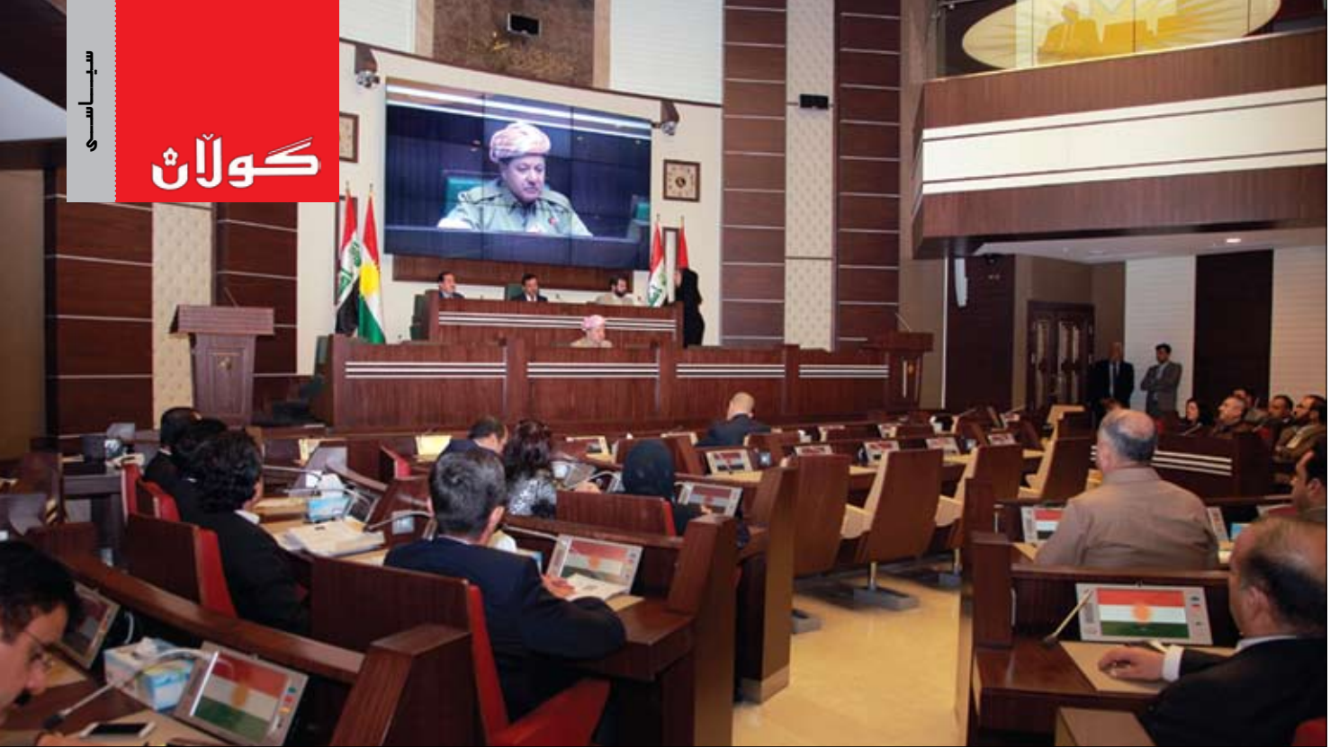
رۇژى ۳ى تەمموز سەرۋىكى كوردستان پەرلەمان رادەسىپىرئىت نامادەسازى بۇ راپىسى بىكەن

مالىكى بۇ ئەۋەدى ھېرش بىكات و ناۋچەكانى موسل و تىكرىت و دىالەو ئەنبار و فەللوچە بىگىرئەتەۋە؟ بىگومان ۋەلامى ئەم گىرمانەش ھەر نەخىرە، ئەمەش لەبەر ئەۋەپە بىنجىگە لەۋەدى پىۋەندى نىۋان بەغداۋ ئەنكەرا لەۋ ئاستە نىيە، لە ھەمانكاتدا، تورىكا نايەۋىت بىتتە لايەننىك لەشەرى مەزھەبى نىۋان شىعەو سوننە.