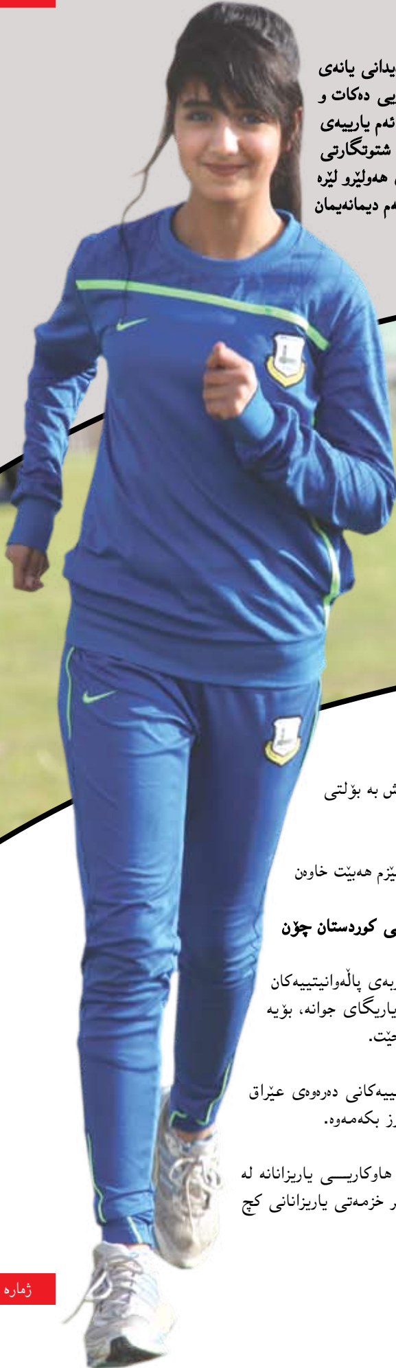
دیسانه: کارزان کانهیی

ژوین یه كيك له كچه یاریزان به تواناكانی تپیی گۆرپه پان و مهیدانی یانهی ههولێرو ماوهی زیاتر له دوو ساله له ریزی یانهی ههولێر یاری دهكات و به ناسته بهرزهكهی و پاكردنه خێراكهی سهرنجی ههوادارانى ئەم یارییهی بۆخۆی پاكیشتاوه، ناوبراو له دایكبووی سالی ۱۹۹۸ی شاری شتوتگارتی ولاتی ئەلمانیا، ماوهی چهند سالێكه گهراوهتهوه شاری ههولێرو لێره دهژی، ئیهمهش بۆ تیشك خستنه سهر چهند لایهنیکی ژیانی ئەم دیمانهیمان له گهلی ئەنجامدا.