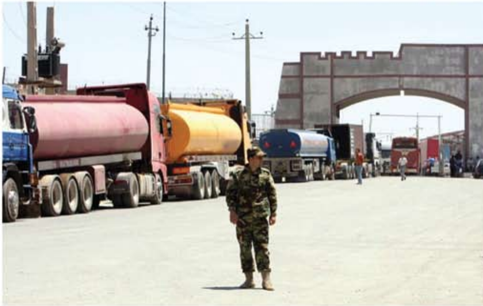
Keep on truckin': guarding fuel trucks in Haj Umran, Iraqi Kurdistan, July 2010.