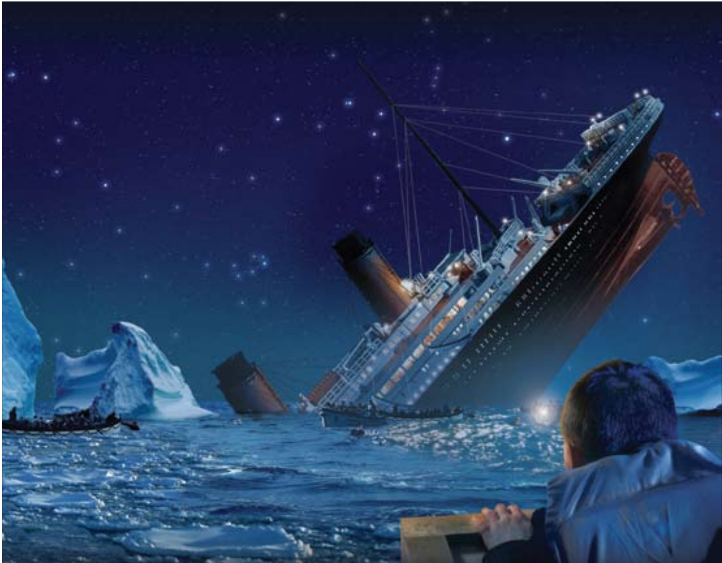
■ ئايا هەلەى چاوەرپێکردنى نوqm بوونى تايئانيك لەسەر عێراق دووبارە دەبێتەو؟

ئەمەریكا زۆر بە راشكاوى بێتە ناو ئەم پرۆسەى دابەشکردنە و بە تايبەتى بۆ چارەسەرى كێشەى ناوچە كوردستانىيەكانى دەرەوى هەريئى كوردستان رۆلى خۆى بىنيئت و بەو راستىە زياتر ئاشنا بێت كە بەبى چارەسەرى كێشەى ناوچە كوردستانىيەكانى دەرەوى هەريئى كوردستان، هەر رینگە چارەبەك بدۆزىتەو ئەكاميئى باشى نايئت. ۳. گرنگە و لاتانى ميانگير و نەتەو يەكگرتووەكان كە دەبنە شاييد لە پرۆسەى دابەشکردنى عێراقدا، دەبێت ئەو راستىە بزائن كە دابەشکردنى عێراق لەسەر خواستى خەلكى كوردستان نەبوو، بەلكو بۆ رېگرتن بوو لەووى عێراق لەبەريەكەهلبووشيت و سەرەنجاميش كېشەو ئازاوه لەناوچەكە دروست بكات، بۆيە لەم