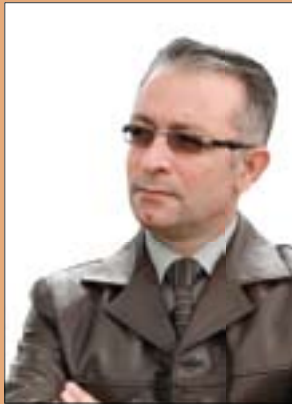
د.سەر بەست نەبى