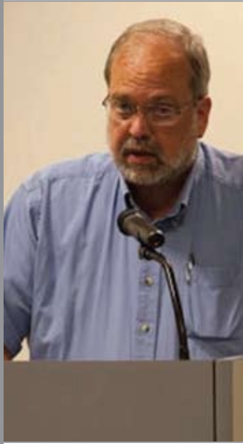
پروفیسور جیم بہترفیلڈ بؤ گولان: