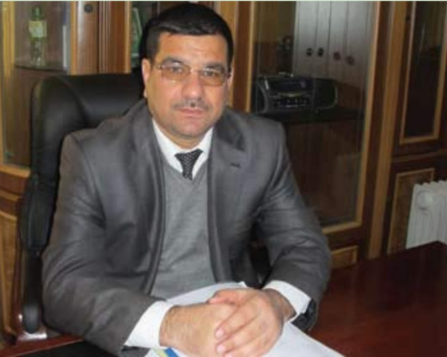
بەرپۆشەری ناحیەى پردى بۆ ( گولان ) :