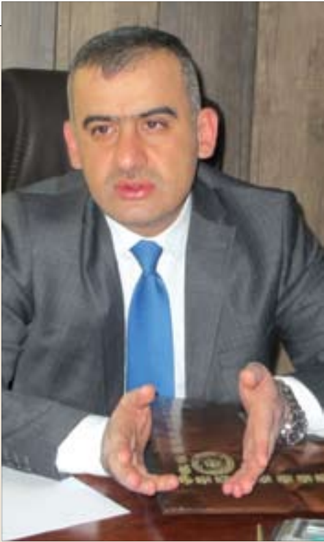
هيو ا قهره نى قايمقامى رانيه بۇ ( گولان):