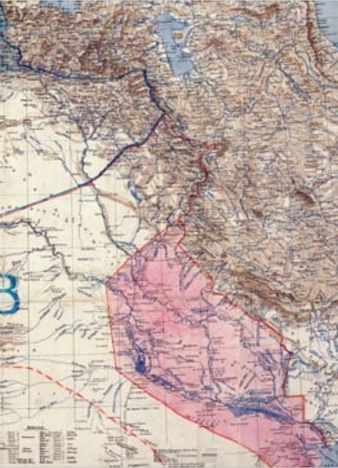
نەخشەى سايكس بيكۆ كە ناوچەكەى دابەشكردووه بەشى A بۆ فەرەنسا و بەشى B بۆ بەرىتانيا بوو

بكریت كه شیوازی دیموكراسی و شیوازی به شداریکردن بۆ مامەلەكردن له گەل پرسى تابه فه گهربدا بگيریتته بهر، راسته ئەمه كارێكى قورسه، به لām مه حال نیهه. چونكه دهكریت وینای بوونی پیگهیه کی گونجاو و دانپیدا تراو بۆ كه مینه ی كوردهكان له تورکیادا بکهین، كه زه مانه تی مافه كه لتوری و سیاسیه کانیان بکات و ئەمه ش گۆرانکاریه کی گهوره له سیاست و له کۆمه لگه ی تورکیادا دروست دهکات، به لām ئەوه زۆر گرنگه كه هەر هه موو كه سێك له تورکیادا شه ری له پیناودا بکات، ههروه ها بۆ په یوه ندیه کانی كه مینه و زۆرینه کانی ش گرنگه. له بهر ئەوه من دلنیانیم له وه ی هه لوه شانده وه ی ئەو دابه شبوونه ی ریککه وتنی سايكس بيكۆ هیناويه تیه ئاراهه، -ببیته هۆی کۆتایی هینان به کیشه کان-، ئەوه ی ده گوزهریت خه باتیکى ناوخوییه له نیو هه ر یه کیک له م ولاتانه دا- ئە گه رچی به دلنیاییه وه ره هندیکی ئیقلمی و جیهانیسی هه یه-، خه بات له پیناوی ئەوه ی هه ر یه کیک له م ولاتانه چی بن، مه به ستم له وه یه نایا رۆلی ئەو هاوولاتیانه چی ده بیته كه بالاده ست ده بن به سه ریاندا و نایا چ سیستیمیکى سیاسى پیاده ده کرین، راسته ئەمه هاوشان بوو به خوینتریزیه کی زۆر و به شه ری قیزه ون كه هاوولاتیان باجیکى زۆریانداوه، به لām مه رج نییه ئەمانه شه ریك بن سه ربکیشن بۆ هه لوه شانده وه ی سنووره کۆنه کان.