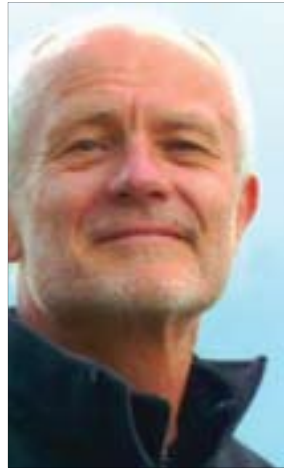
پروفيسۆر مايك موور بۆگولان:

- رەنگە تاكه هۆكارىك بۆ ئەم دۆخە برىتى بيت له هەلكشانى نايەكسانى ئابوروى و كۆمەلايهتى لەسەر ئاستى جيهاندا، ئەمە فشار دروست دەكات كه هەندى لايەن ناتوانن خويانى له گەلدا بگونجىن. حالى حازر له چيندا نايەكسانىمى كۆمەلايهتى گەوره هەيه كه هاوشانە بە گەندەلەكى بەرلاو، ئەمە له كاتىكدا دە سال پيش ئىستا خەلكى ئامادەبوون متمانە بە حكومتهتى چين بكن، لەبەر ئەوهى دەرئەنجامىكى ئابوروى باشى بەدەست دەهينا كه خەلكى لى سەودمەند دەبوون، ئىستا دۆخىك هەيه كه هەندى كەس زياتر لەوانى ديكە سەودمەند دەيت، و ئابوروى دووچارى كيشىمى بووه و خەلكى زياتر و زياتر نىگەرەن دەبن لەبارەى مافەكانيان و پيسبەونى ژينگە و خواردنى