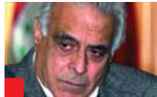
موفىد جەزائىرى بۇ گولان: بەلایى سەرەكى لە دابەش بوونى تائىفى و نەتەوہىيەو ەھىە و ەمر ئەمەشە دەپتە ھۆى ئەوہى كەسى گونجاو لە شوئى گونجاو دانەنرئى