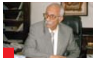
عامر ەسەن فەياز بۇ گولان: ئەگەر باس لەو شتانە بەكەين كە پىوہستن بە جىبەجىكردى ئەركەكان لەسەر ئاستى موئەسەساتەكان بەپى ناوہىنانى ەپچ كەسىك، دەپىنن ەپچ پىشكەوتنىك نىيە ئەگەر نەلپىن پاشەكشى ەھىە

ئەم بۆچوونەى سەرەو، راي پىرۆفىسۆر عامر ەسەن فەيازە كە لە خولى ەلپىاردنى پىشسوودا كاندىدى پەرلەمانى بوو لەسەر لىستى دەوئەتى ياسا، ئەمەش ماناى ئەوہى ەكومەتى ئىستىئای عىراق بە سەرۆكايەتى نورى مالىكى بەھۆى ئەوہى تەنھا خەمى ئەوہىتى چوون ەموو جومگەكانى دەوئەتى عىراق كۆنترۆل بىكات، ئەوا ەموو ولاتى يەكبارچە كىردتە دۆزەخ و تواناى پىشكەشكردى