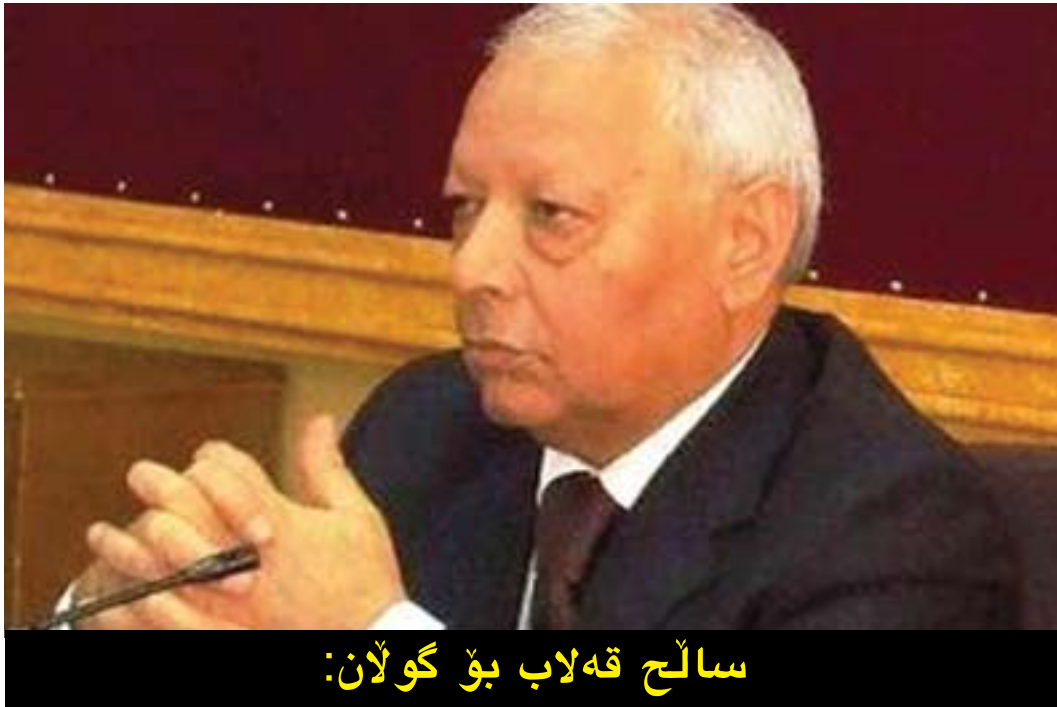
سالج قهلاب بۆ گولان: