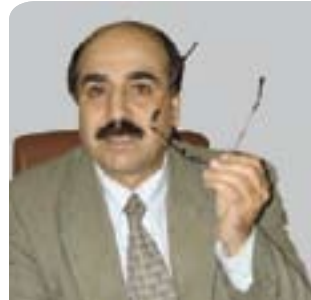
فه رید ئەسه سه ره ر بۆ گولان ده ینووسیت

پارتی دادو په ره پیدان له ژێر فشاری دوو هه لپژاردنایه. یه کیکیان هه لپژاردنی نازاری ئاینده ی شاره وانیه کانه و نه وی تر هه لپژاردنی هاوینی ئاینده ی سه ره کایه تییه که دیاره به ته مایه هیچ کامیکیان نه دۆرینی و پیده چی له هه ردوو هه لپژاردندا دوو چاری دژواری بی. ئەمه وای لئده کا هیچ هه نگاویکی وای نه نی شه قامی تورک بره نجینی. به لام له به رامبه ردا، پارتی دادو په ره پیدان که له ناسنامه دا حزیک ی پارێزگارو نه ریتپارێزه، زیده پۆیییه کی زۆر له م سیمایه ی پارێزگاری و نه ریتپارێزی خۆی ده کاو به هه نگاوی خیرا فایلی مه سه له ی نه ته وایه تییه کورد به رپۆه نابا. له بییرکردنه وه ی پارێزگارانیدا، حزب به نیازه تا سالی ۲۰۱۳ هه ندی هه نگاو بۆ چاره سه رکردنی مه سه له ی کورد بنی، به لام نه وه ده سه تکه وتانه ی که حزبه که ده یه وئ له ماوه ی ده سالی داهاوو بۆ کورد به ده ستیان بینی، لیان رانابیری بتوانن شه قامی کورد به نارامی به یلنه وه. ئەمهش به خویندنه وه ی دیکۆمینتی «تیروانینی سیاسی پارتی دادو په ره پیدان تا سالی ۲۰۲۳» باشتر روون ده بیته وه که تییدا حزب به لینی داوه تا سالی ۲۰۲۳ یاسایه ک بۆ به رگری له خۆکردن به زمانی دایک له دادگاکان ده ریکاو هه لومه رجه ی پیوست بۆ نه هیشتنی جیاکاری ره گه زی فه راهم بکات که ئەمهش، به دلنیا ییه وه، به س نییه بۆ دۆزینه وه ی ریبه راسته که.