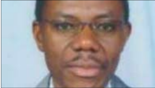
پروفېسسور جۇنيۇ فريد نۇپيۇ بۇ گولان:

- پارتە سياسىيەكان ئامرازىكى گرنگن بۇ ديموكراسى، لەبەر ئەوھى خەلكى لەسەر بەھاكانى حكومراني پەروەردە دەكەن و ئەو خەلكانە ئامادە دەكەن كە كاروبارە گشتىيەكان بە شىۋەيەك بەرپۆھبەن كە جىي رەزامەندى بىت و ھەمووان لە خۇبگىر، ھەروھە پارتە سياسىيەكان گرنگن بۇ ديموكراسى لەبەر ئەوھى بەرگى لە بۇچونى خەلك دەكەن و بوار بە خەلك دەدەن پەرە بە فەلسەفەيەكى ديارى كراو بەن، كاتىكىش مەملانى سياسىيە لەبارەى ئەو بۇچونانە دروست دەبىت، ئەوا مەملانى سياسىيەكە پەيوەست دەبىت بە پرسەكانەوھە. بە واتايەكى ديكە خەلكى لەسەر بەرنامەيەكى ديارىكراو مەملانى دەكەن، ئىتر چاودىرى تەندروستى بىت، ئىدارەى نابوورى بىت، بەرنامەى خۇشگوزەرانى بىت، يان پەيوەست بىت بە داينكەردنى ئاسايشەوھە. لەلايەكىشەوھە پارتە سياسىيەكان گرنگن بۇ دروستكەردنى سەركردايەتى جياواز، لەبەر ئەوھى سەركردەى جياواز پىويستى بەبژاردەى ئازادە و پارتەكانىش مەنبەرىك فەراھەم دەكەن بۇ مومارەسەكەردنى بژاردەى ئازاد، بەو شىۋەيە پارتەكان دەبنە لايەنىكى زۇر گرنگى ديموكراسى. لە كۆتايىدا دەلئىم پارتە سياسىيەكان زەمىنەى راھىنانن، تاكە كەسەكان رادەھىنن و تواناكانىيان بنىات دەننن، ھەروھە تەركىزىكى گونجاو بە تاكە كەسەكان دەدات كە تا چ راددەيەك مومارەسەى دەسەلات بەكەن، ھاوشان بە تواناي ئىدارەكەردنى