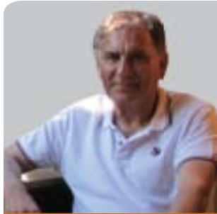
دوغو ئەركىل* تايبەت بە گولان نامادەى كرددوۋە

نايا دادگاييكردنى نەرگەنەكۆن ھەموو ئەۋانە دەگۆرپت و رىنگاى بە دىموكراتىكردن دەكاتەۋە لەبەردەم سىستى سىياسى و قەزائىيەكەدا؟ ئەگەر نەتوانا ئەم نامانجە پىنترىتەدى، نەك تەنھا دەرەفەتىكى مېژۋىيە لەدەست دەدەرت، بەلكو خەلكى ئەم ديارە گرنگە ۋەك يەكلاكردەۋەى حساباتى ئىۋان دەسەلاتدارانى پىشوو و ئىستادا سەير دەكەن. چىتر نەرگەنەكۆنىش ۋەك سىمبولى رزگارى و ئومىد دانانزىت.