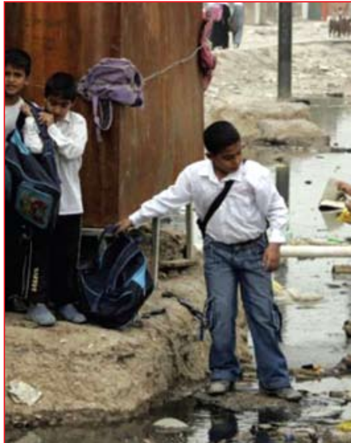
نه بوونی حوکمرانی باشه