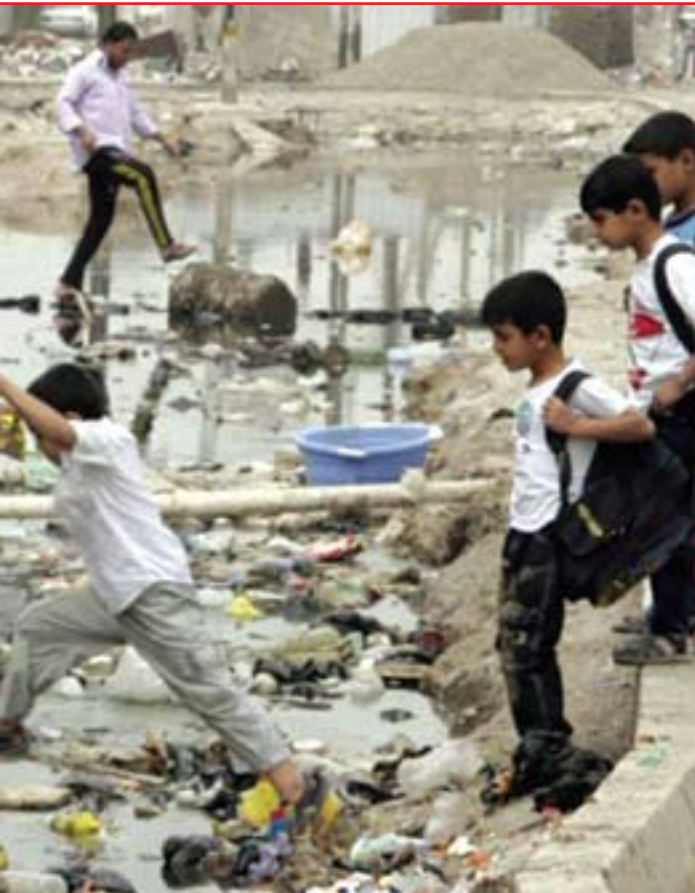
هۆكاری بنه پهتی ناسه قامگیری له عیراق

هۆشیار زبیری: له بهر چه ند هۆیهك، له وان هۆكاری هه ره سه ره كی ته وهیه ئیمه ده ستوور ئی قرا ر كرده وه، گه ل دهنگی له سه ردا وه بۆ ته وهی ئه م ده ستووره ژیا نی نیو كۆ مه لگه وه ده وه ت ر ئی ك ب خا ت، به لآ م تا كو ئی س تا ئه م ده ستووره وه ك ك تی بی كی كرا وه به جی ما وه، وا تا كۆ تا یی پی نه ها تو وه ته فسیرا ت و را قه ی جودا جودا ههیه بۆ ئه م ده ستووره وه هه ر كه سیك به هه وای با لی خۆی را قه ی بۆ ده وه ژن ته وه، تا ئه م ده ستووره وه ك ك تی بی ك لای هه موو لایه ك ئی قرا ر نه كر ی ت ئه م كی شانه هه ر ده مین ته وه، دو وه م گۆ را نكار یی ه كی گه وه له بارو دو خی عیراق رو ویدا وه، هه ندیك ه یزی كۆ ن ده سه لا تی ان نه ما وه كۆ مه لیك ه یزی نو ی به ئی را ده ی جه ما وه ری و له ر پۆ سن دو قی هه لپا ژار نه وه ها تو نه ته سه ر كار كه تا ئی س تا ئه م وه ر چه ر خا نه له لای خه لكا نێك ئی س تی عاب نه كرا وه، له لایه كی تره وه ده ستی وه ردا نی بی گانه ههیه له كاروباری ناو خۆی عیراقدا، دو ات ر پی وی س ته سه ر كرده سیاسی هه كانی عیراق گه وه تر بن له به ر ژه وه ندی بی حز بی و تا یه فه گه ری و ناو چه یی و ته نا نه ت نه ته وه یی، پی وی س ته به چا و ئی كی گه وه تر ته ما شای ئه م بارو دو خه بكه ن و هه موو لایه ك پی وی س ته سا زش بۆ لایه كه ی تر بكا ت تا ده كه نه چاره سه ری كی ما منا وه ند، تا له م نا ر ده ح ته ی و ناسه قا مگی ری ه عیراق ر زگا ری بی ت.