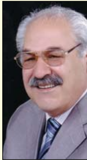
فلک الدین کاکه‌یی

بیری سیاسی کورد له سه‌ده‌ی بیستهم به دوو پیشکەوتنی گرنگ گه‌یشت، یه‌که‌م دوا‌ی جه‌نگی یه‌که‌می جیهانی (۱۹۱۴- ۱۹۱۸)، دووه‌م له‌گه‌ل کۆتایی جه‌نگی دووه‌می جیهانی (۱۹۴۰- ۱۹۴۵) وه‌ختی ته‌وژمی بزووتنه‌وه‌ی سۆسیالیستی و، سیستهم و بیروبو‌چوونی دیموکراتی به دنیا بلاو بووه‌وه، ئه‌وه ئیتر بزووتنه‌وه‌ی رزگاربخواری کوردستان که‌وته بایه‌خدا‌ن به‌هه‌ردوو لایه‌نی رزگاری کۆمه‌لایه‌تی و رزگاری سیاسی. له‌و میانهدا ناوه‌بناوه‌باس له رزگاری و سه‌ره‌خۆیی ده‌هاته‌پیش، چ له‌ریگه‌ی هه‌ندی که‌سایه‌تییه‌وه یا له‌ریگه‌ی هه‌ندی ریکخراوی سیاسییه‌وه. بیری سیاسی کورد، به‌دریژایی سه‌ده‌ی بیستهم و سه‌ره‌تای ئه‌م سه‌ده‌یه (بیست و یه‌که‌م)، هیشتا مه‌لۆتکه‌مایه‌وه، نه‌هاته‌به‌ر، تانیستا یه‌که‌سه‌رو، کوتوپر، ئه‌م کۆریه‌جوانه‌خه‌ریکه‌ده‌رده‌که‌وی، مه‌به‌ستم هه‌ولدا‌نه‌بۆ کۆنگره‌ی نه‌ته‌وه‌یی.