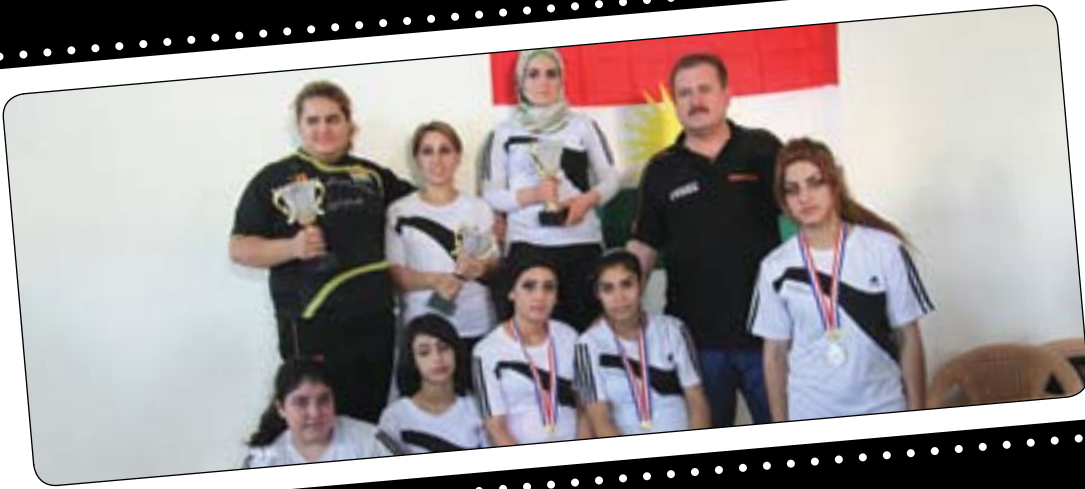
پاڤورت: کارزان کانیدی

رنگه‌مان ده‌دات له ئیو قوتابخانه‌که‌مان مه‌شق و پراختیانه‌کانی خۆمان نه‌نجام بدین، له‌ئیستاشدا ناستی یانه‌که‌مان باشه بۆیه پیوستیمان به گرنگی‌دانی زیاتره له‌م یارییه، له‌سه‌ر لایه‌نی به‌هرسه‌ش پیوسته گرنگی زیاتر به‌ کردنهوهی پالده‌وانیتهی به‌رزکردنهوهی قورسای کچان بدن بۆئهموی کچه یاریزانی دیکه له‌ شاره‌کان زیاتر ږوو له‌م وهرزشه بکهن ئیتمه به‌ نامانج و هیسوای زۆروه ئهم وهرزشه ده‌که‌بین و ئۆمیدی باشمان له‌ پینشه بۆخزمه‌ت کردنی ئهم یارییه و دوویات کردنهوهی خۆمان له‌ وهرزش و زیندوو کردنهوهی ئهم یارییه له‌ شاری هه‌ولیر.