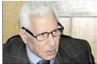
موکهره م محمه د ئه حمه د: ئه م شوپرشه ده سپنکیکی تازه یه بۆ راستکردنه وهی شوپرش ی ۲۵ یانایرو ولاتی میسر ده باته قوناعیکی نوئی سه قامگیری و دیموکراتیه ت و بونیادنانه وه به مه رجیک میسیرییه کان پیکه وه ژبانی نیشتمانی خۆیان ده ست پیوه بگرن