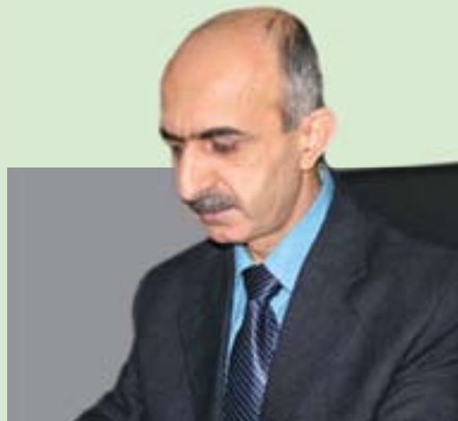
عه بدولپه حمان سديق