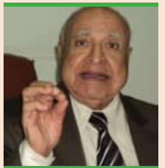
پروفيسور ئىبراھىم دەرويش:

ياسايە، دەستورىش دادەنرىٲ و تەشرىح ناكریٲ، بۆيە ھەتسا ئەگەر پەرلەمان ئەو دەستورە دا بنىٲ، ئەوا بە سىفەتى دەسەلاتى دامەزرىنەر ئەو كارە دەكات نەك بە سىفەتى پەرلەمان، شىوازيكى دىكە بۆ دانانى دەستور بە رىنگەى پىكھىنانسى لىژنەيەك دەبىٲ كە ئەركى ئامادەكردى پەرۆڤى دەستورى پىدەسپىردىٲ، ئەم لىژنەيەش دەسەلاتى دامەزرىنەرى دەبىٲ و پىٲى دەگوتىٲ لىژنەى ئامادەكردى پەرۆڤى دەستور، واتە دەستورەكە ئامادە دەكات بۆ ئەوئى پەسەند بكرىٲ، كى ئەم دەستورە پەسەند دەكات بىگومان لە راپرسىدا مىللەت پەسەندى دەكات، بەلام مىكانىزمى ناردى ئەم پەرۆڤى ئامادەكراو بۆ پەسەندكردى لەلایەن مىللەتەو بەو جۆرەيە، لەبەر ئەوئى پەرلەمان ئەو لىژنەيەى پىكھىناو، ئەوا ئەو لىژنەيە كە كارەكانى تەواو كرد دەباتەو پەرلەمان، دەنگدانى پەرلەمان بە پىٲى ياسا لەسەر رەشنوسى دەستور بۆ ئەوئى بىنرىٲ بۆ ئەوئى خەلك تەسدىقى بكات، بۆ ئەوئى مەسەلەكە زياتر روون بكەينەو، راستە پەرۆڤى دەستور وەك ياسا لە پەرلەمان دەردەچىٲ و بە پراسىبى معيارى ئەو پەرۆڤى ياسايە، بەلام جىوازى ئەم پەرۆڤى وەك ياسا لە ياساكانى دىكە ئەوئى، دواى دەرچوونى لە پەرلەمان راستەوخۆ جى بەجى ناكرىٲ، بەلكو پىويستە مىللەت دەنگى لەسەر بدات بۆ ئەوئى دەستورەكە پەسەند بكرىٲ و دواى پەسەندكردى جىبەجى بكرىٲ، ئەم لىژنەيەى بۆ پىداچوونەوئى دەستورى ھەرئى پىكھىناو، تەنيا لایەنى دەستورىەكەى پەرۆڤى كە ھەلەسەنگىننىٲ، رەھەندى سياسى ئەم پەرۆڤى پەيوەندى بەم لىژنەيەو نىيە، ھەروئى رەھەندە سياسىەكان پەيوەندى بە لایەنە سياسىەكانەو ھەيە، ئەوان دەتوانن لەدەرەوئى ئەم پەرۆڤىە پىكەو دىالۆگ بكەن و بگەنە رىككەوتنىك،