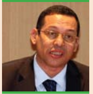
پروفيسور ئەيمەن سەلامە:

ناكریٲ جارىكى دىكە دەستور(دەستورى ھەرىمى كوردستان) بگەرپتەو ھەروەھا لەبەر ئەوئى ناوەرۆكى دەستورەكە ھاوڤۆ نىيە لەگەل پەيماننامە نۆو دەولەتەكان بۆ مافەكانى مرۆڤ، ئەوا ناكریٲ بگەرپتەو بۆ پەرلەمان، تەنيا لەيەك حالەتدا دەكریٲ دەستور بگەرپتەو بۆ پەرلەمان، ئەو حالەتەش ئەوئى كە لە دەستورەكە ئەو مافانە نەچەسپینرابن كە لە جارى گەردوونى مافەكانى مرۆڤدا ھاتوون، بۆيە ياسا ناوخۆيەكان كاتى ديارىكراو بۆ راپرسىەكە ديارى دەكەن بۆ ئەوئى دواى ئەو گەل خاوەنى دەنگى راستەقىنەى خۆى بىٲ دەبىٲ لەلایەن ھەمووانىشەو گوىى بۆ بگىرىٲ.