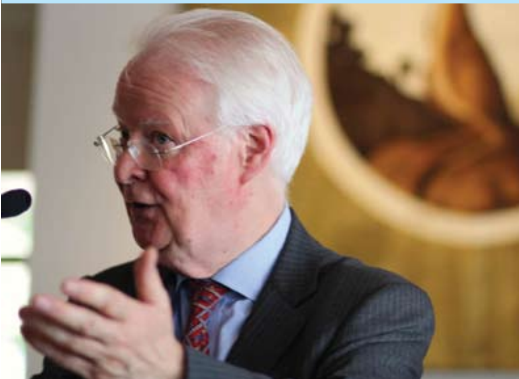
لورد مايكل وليامز ((ديپلوماتكارى بهریتانى)) بۇ گولان: