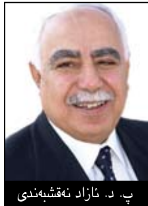
پ. د. نازاد نەقشبندى