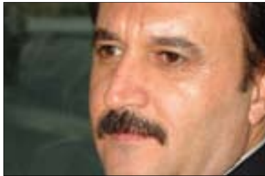
میديای نوئ و پرسی شوناس