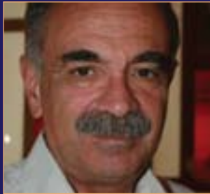
پروفیسور میشیل شیفوورکا *