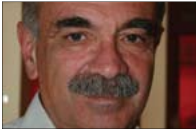
تیروريسم به رووتی