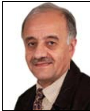
پ. جهمال ره سول محه مه دنه مین*