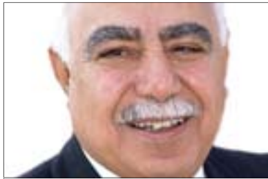
پيويستی نه ته وه له کاته هه ستیاره کاند