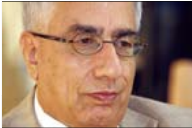
کورډ و کرایسکی