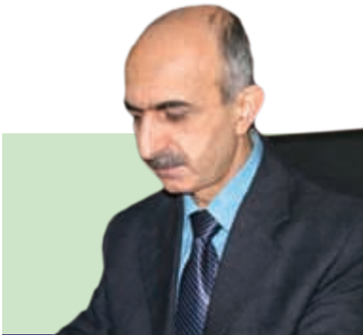
عه بدولپرهمان سديق