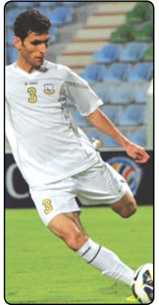
راپۇرت: زېيىن رەمىزى