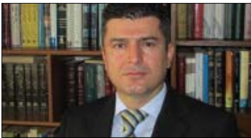
پروفیسۆری هاریکار بکتۆر عەلی تەتەر نیۆرویی