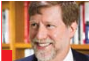
مارک کاتز بۆ گولان: هیچ ئەگەرێک بۆ ئەنجامدانی رینگەوتن لەگەڵ ئەسەدا نییە، بەلکە دەبێت بروت، ئەگەرنا چارەنووسی وەك قەزافی دەبێت

بەلام ئەوەی لەم بارە چەقەستوو لەسەر ئاستی دیپلۆماتی و سیاسیی هەستی پێدەکێت، لەسەر ئاستی روویەروونەووی ئێوان چەکاران و سوپای ئەسەد، هەست بەمەترسیەکی گەورەتر دەکێت و مەزەندی ئەو دەکێت بارودۆخەکە