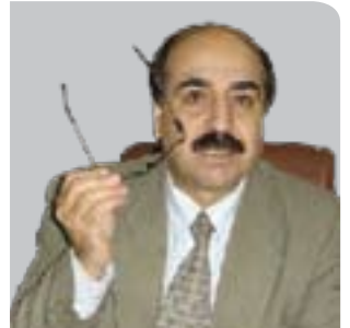
فه رید ئەسه سه ره ر بۆ گولان ده ینووسیت

بۆ تورکیا ترسه ناکترین نه گه ره نهویه که عیراق، پاش راکیشانی بۆری رومیله - عهقه به، له ماوه ی چه ند سالیکیدا په ره ی پی بدا و بیکاته هیل ی دووه می ستراتیجی ناردنه دهره وهی نهوت یان بیکاته هه لته رناتیقی هیل ی کهرکوک- یومورتالیک. نه گه رچی ئەم نه گه ره تانیستا به دوور ده زانی، به لām په رپیدانی هیل ی رومیله - عهقه به شتیکه ده وه ستیته سه ر ئاره زووی به غدا که ده توانیت له کاتی پیوسته دا بریاری لی بدات، به تابه ته ی که ده توانی کارت ی برینی نهوت له تورکیا به رامه ره به کارت ی برینی ئاو له عیراق به کار به ینریت.