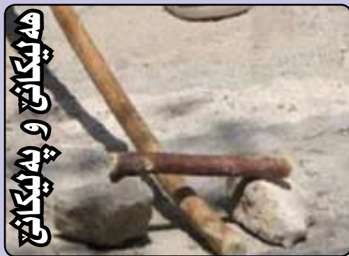
ھەپكاش و پەپكاش

چەندىن گەمە و يارىي كۆن لە كوردەوارى ھەن، جاران ھەر يارىيەك جۆش و خۆشچىكى جوانى ھەبوو، تەننەت تاوەكو ئىستاش ئەو يارىانە بەردەوامن، زياتریش لە گوند و شوئە نەتەو بەيەكان، يەكئەك لەو يارىيە خۆشانەى كە يىنگومان كەسانىكى زۆر ئەو يارىيەيان كوردوو، بە تايبەت رەگەزى كۆر، ئەويش (ھەليەك و پەليكانى) يە. شۆھى يارىيەكە خۆشە و تەننەت يارىي ئىستاي جىھانى (بەيس بۆل)، لەم يارە كوردىيەى خۆمان دەچىت، شۆوازي يارىيەكە و جۆرى دار و پەليەكەكە بەم شۆويەيە : لە دوو بەش پىكديت كە دار و پارچە دارىكى بچووكە،