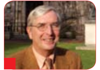
كرىستىيان ھىرپەر بۇ گولان:

چۈن دەۋانەت ئەم رۇلە بگىرپت؟ من پىموايە دەبىت توركىيا بە شىۋەيەك رۇل بىبىنەت كە لەلايەك پىشتىۋانى ناتۇ بىكات و لەلايەكى دىكەشەۋە ۋا دەرنەكەۋىت كە داردەستى ئەمىركايە لە رۇژەلەتى ناۋەرەستادا، چۈنكى ئەمە دەبىتەھۆي لەدەستدانى پىشتىۋانى لە ناۋ توركىيا و لە ناۋچەكەشدا. كەۋاتە ھىزى ئىقلىمى گەۋرە ھەن و دەبىت بە ھەزەر بىت بەو شىۋەيە لىتەنەرۋانەت كە زۇر پىشت بە لايەنى دىكە دەبەستىت. بۇ نمونە بەم دوايىيە ھىزە ئەلمانىيەكان ھاتن بۇ دانانى موشەكى پاترىۋت، بەلام خۇپىشاندانى گەۋرە لە توركىيا لە دژى ئەمە ئەنجامدارا، ھەرۋەھا ئەگەر سەيرى