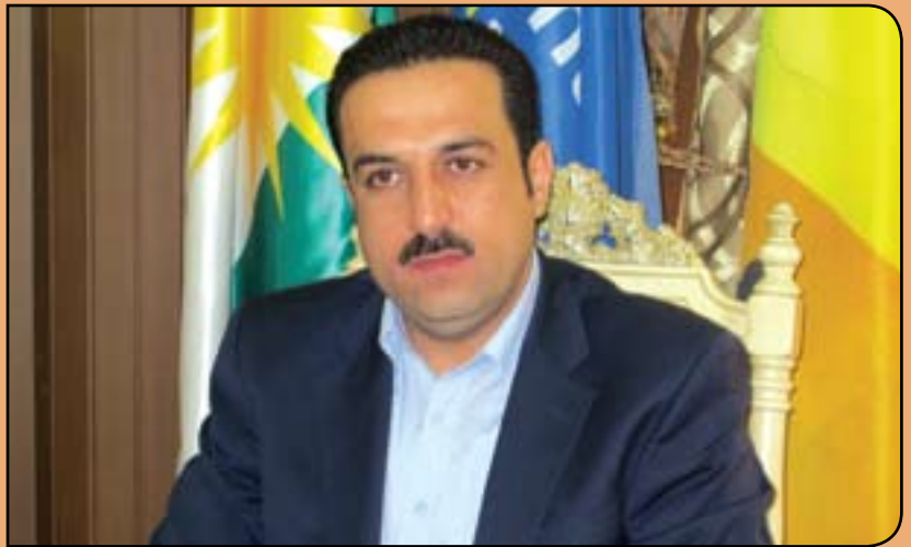
سىكرىتېرى يەككىتى لاوانى دىموكراتى كوردستان:

ئومىد خۇشناۋ سىكرىتېرى رىكخراۋى لاوانى دىموكراتى كوردستان لە بارەى سەرەتاكانى رىكخراۋەكەۋە وتى: (تەمەنى جىباكردەۋە پاراستنى تايىبەتەندىتى لاوان بۇ ۶۰ سال لەمەۋبەر دەگەرپتەۋە، ئەو كاتەى بارزانى نەمىر ۋەك رابەرى بزوتتەۋەبى رزگاربخوازى كوردستان و سىمبولى نەتەۋەبەتەى كورد، لەسۇنگەى گىرنگىدان و كاراكردىنى رۇلى لاۋانەۋە رىكخراۋىكى بۇ قوتاييان