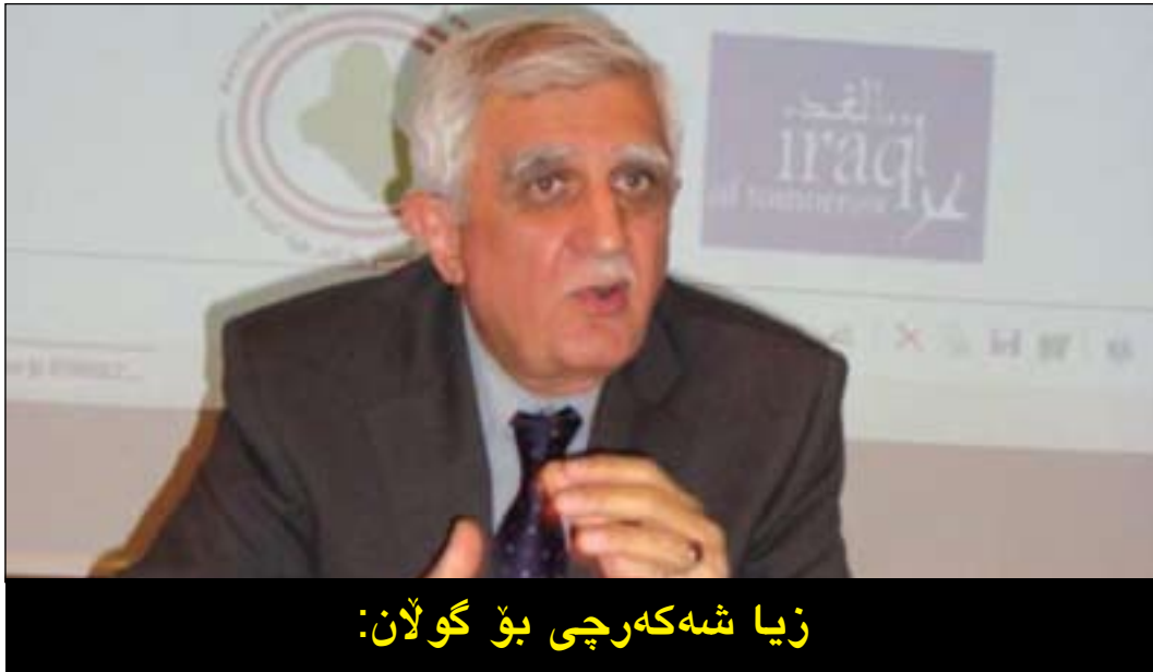
زیا شەكەرچى بۇ گولان: