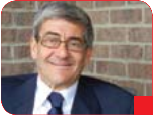
پروفیسۆر ئۆلمەرت بۆ گولان: