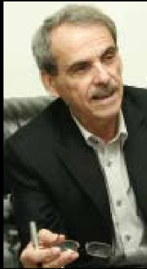
ناسۆ که ریم