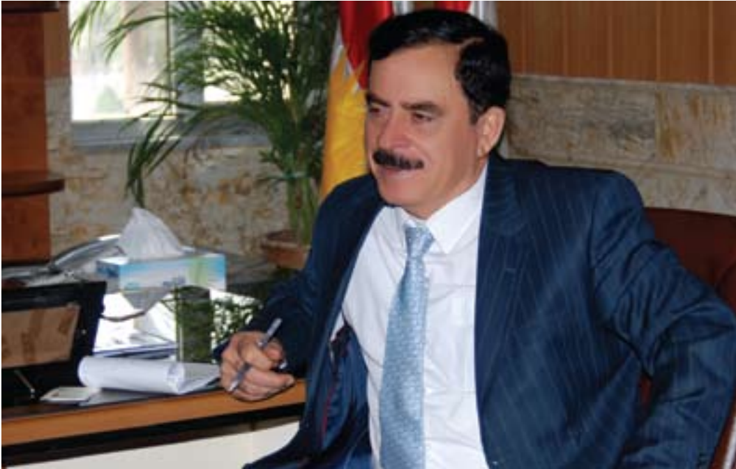
رهشید تاهیر بریکاری و وزارتتی دارایی و ئابووری بۆ (گولان):