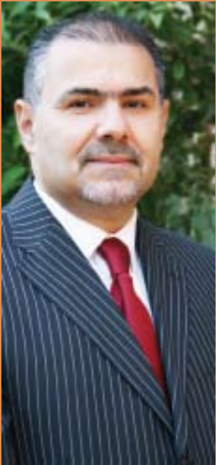
شۇرش عزیز سورمى