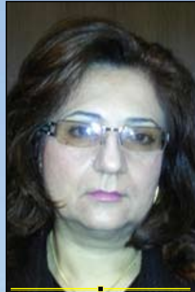
پەرلەمانتارىك: ياساي بەرەنگارى توندوتىژى خىزانى زۆر فراوانەو ھەموو جۆرەكانى توندوتىژى بىنېردەكات