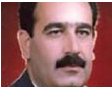
ئازاد سىرىشمەپى بۇ گولان:

نيوان پيڭكاته كان، ئەمريكيه كان پيشنبارى ئەوهيان بۇ حكومەتى خۇيان كرووۋە بەۋەى ئەمريكا يارمەتتە كانى لە عىراق بىرپىت ھەتا نورى مالىكى سەرۋك ۋەزيران دەستبەردارى تاكروۋى دىكتاتورىيەت دەپت، بەلام پرسبارى گىرنگ لىزەدا ئەۋەپە ئايا پيڭكاته سەرەكپە كانى عىراق دەپ چى بكنە بۇ ئەۋەى عىراق لەم كارساتە رزگار بكنە؟ ۋەلامى ئەم پرسبارە بە سادەپى و بەپلەى يەكەم بەستراۋەتەۋە بە ھەلۋىستى لايەنە شىعەپە كانى ناۋ ھاۋپەيمانى نىشتمانى، بەتايپەتى كە ئەۋانېش (بىجگە لەلىستى دەۋلەتى ياسا) ھەستيان بەۋ