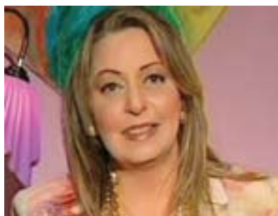
فانیزه باباخان بۇ گولان:

ئىستا ھەستدەكرپىت برپارەكانى دادگای فیدرالی بەلایى حكومەتدا دەشكىتەۋە و بۇ بەرژوۋەندىيە حكومەت برپارەكان دەردەكات، من ۋەكو نموۋەپەك باسى ئەۋەم كىر كە چۇن پەرلەمان مافى ئەۋەى نىپە ياسا دەربكات، كە لە بنەرەتدا ئىشى پەرلەمانە ياسا دەربكات، پىشترپىش باسى دەستە سەرپەخۇكان كرا كە دادگایە دىسان گوتبوۋى كە ئەم دەستە سەرپەخۇپانە دەپى سەر بە حكومەت بن، ئەۋەش جىگەى گومانە چۇن سەرپەخۇن و چۇنىش دەپت سەر بە حكومەت بن، كە دەستور چۇن ياساى بۇ ھەموۋ شتەكان دەستنىشان