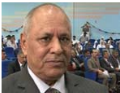
عاشور كەربولى بۆ گولان:

نىيە، چونكە گومانى ئەوھى لىدەكرىت كە ئەو كيشانەي دەچنە لای بەسىياسى كرابن، يان لەلایەنىكەوھ كۆنترۆلكرابن، يەكىك لەو بېرارانەي دەرىكدووھ ئەوھىيە كە پەرلەمان بۆي نىيە ياسا دەرىكات، چونكە دەستور لە ماددە(۶۴)دا باس لەوھ دەكات كە دوو لايەن ھەن دەتوانن پىرۆرە ياسا و پىشنىارە ياسا دەرىكەن، يەكيان بېرگە (أ) كە سەرۆكايەتى ئەنجومەنى ھەزىران و سەرۆكايەتىيى كۆمار، بېرگە (ب)ش دەليىت دە ئەندام پەرلەمان يان لىژنەي تايبەتمەند بۆيان ھەيە كە پىشنىارى پىرۆرە بكەن، بەلام دادگاي