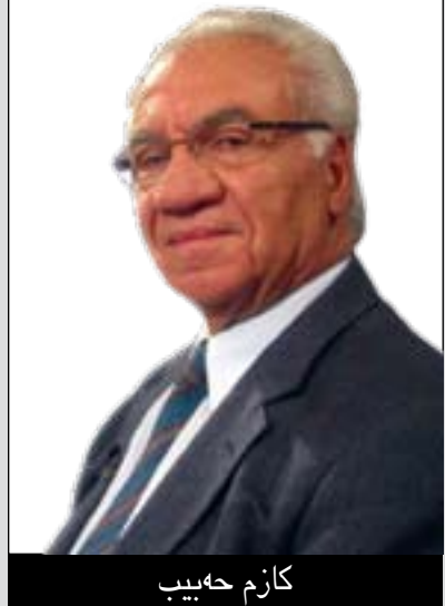
كازم ھەبىب تايەت بۆ كولان نووسىويىتى