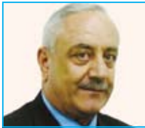
ساله تۆما بۆ گولان:

هیزی دیجله نه دستورییه نه یاساییه بۆ ئه‌وه‌ی به‌سه‌ر پینکاته‌ی کوردی بسه‌ پینریت