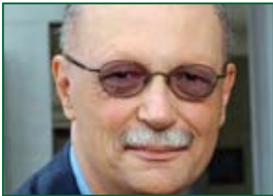
دبىقە لاك بۆ گولان:

لىيان نەروانزىت، جگە لە حكومراىيەكردن لە رېئى زەبر و زەنگەو و جگە لە دامەزراندنى رېئىمىك لەسەر زەمىنەبەكى سەربازى-هەروەك نۆبە ئاماژەى پىدەكەن-چارەبەكى دىكەيان نىيە، بەلام ئايا ئەمە سەردەكىشەت بۆ دەولەتتەكى شكستخوار، مەرج نىيە، چونكە هەندى حكومەت هەبوو كە ماوئەبەكى دوورودرېژ حكومراىيان كەردوو لە رېئى بەكارهۆنانى هۆزەو دژى خەلكەكەى، سەددام حوسەين نۆمەبەكى روونە لەم رووئە، رەنگە رېئىمىكى شەرى نەبىت و لەلايەن خەلكەو هە پشەتوانى لىنەكردت، ئەو حكومەت ئەتوانىت دەرژە بە حكومراىيەبەكى بدات، بەلام لە رېئى بەكارهۆنانى هۆزەو دژى خەلكەكەى، ئەمە حالەتتەكى ئىمە كارى بۆ ناكەين، بەلام مەرج نىيە سەربەكشەت بۆ دەولەتتەكى شكستخوار. هەربۆيە رەنگە باشتر بىت بۆ كۆمەلگەى نۆدەولەتى كە