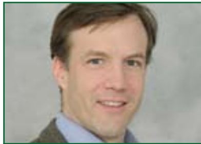
ستىبورت پاترىك بۆ گولان:

گومانى تىدانىيە بوونى شەرى ناوخۆ بە ماناى ئەو دەت كە حكومەت شەرىيەتى لە نۆبەشەكى گەورەى دانىشتوانەكەيدا لە دەستداو