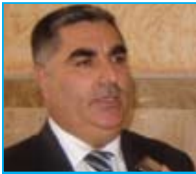
مه‌حما خه‌لیل بۆ گولان:

هیزی دیجله نه دستورییه نه یاساییه بۆ ئه‌وه‌ی به‌سه‌ر پینکاته‌ی کوردی بسه‌ پینریت