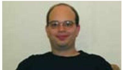
تۆماس ئەمبىرسۇى بۇ گولان:

ئاستە گرنىگ نىيە، بەلام ۋا نىن و پىۋىستە ئىقىرى پىبىكەيت و مامەلە لەگەل دىلئسۇزى نەتەۋەيىدا بىكەيت، چۈنكە كاريگەرتىن ھىزن لە رۇژگارى ئەمرۇدا، بە شىۋەيەكى گىشتى پىم ۋايە ناسنامەى نەتەۋەيى ئىنتىماى نەتەۋەيى گروپىكى نەتەۋەيى دادەپىزىت و ئەۋ ۋلاتەى بەشىكى لىنى، بۇيەپىم ۋايە ھەستى نەتەۋەيى و ناسنامە و دىلئسۇزى نەتەۋەيى زۆر گرنىگن)). پىرۋفىسۇر ستىشان فان ئىقىرا نامازەى بەۋەكرد تەنەنەت كاتىك كە ئالا كۆن دەيىت و پىۋىستە نوى بىكرىتەۋە، ئەۋا نوپىكردەۋەكە رىۋرەسىمى خۇى ھەيە و ھەر ئەۋەندە نىيە ئالايەكى تازە بىتىن و ئالا كۆنەكە فىرى بىدريت، بۇيە لەم چوارچىۋەيدا پىرسىارى ئەۋەمان لىكرد ئايا ھەلكردى ئالا چۆن سەير دەكەيت؟ ئەۋىش بەمبۇرە ۋەلامى پىرسىارەكەى گولانى دايەۋە: (بە زۆرى خەلكى لە دەۋرى ئالا كۆدەبىنەۋە و ئالا بەكار دەھىنن ۋەك رەمىزىك