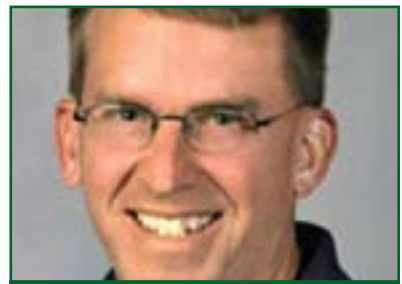
مارك سىمۇن بۇ گولان: كۆمەلگەى نىودولەتى چانىكى ناستىزى لەپىشە لەرووى رىنگەگرتن لە بەفاشىلبوونى دوولەتەكان بەتايبەتى شەرى ناوخۆيىان تىدا ھەپئىت

توندوتئزى دەگرنەبەر، بەراى من رىنگەچارەيەك بۆ كەمىنەكان بۆئەوئەى تىوان شكىست بەو رزئمانە بىنن برىتئىيە لە گرتنەبەرى تەكتىكى ناتوندوتئزى، بۆئەوئەى شۆرشەكانى بەھارى ھەرىئى لەگەل دەبان شۆرشى دىكەى ناتوندوتئزى ھەر لەسالى ۱۹۸۹و لە ولاتانى ئەوروپاى رۆژھەلات تا شۆرشەكانى دىكە لە ولاتانى يەكئىتى سۇقئىتى جارن، لەبەرئەوئەى شەرىيەتى ھۆكۈمەت پەيوەستە بە ھەرۆك لە پىشتگىرى ناوخۆيى و نىودولەتى ھەرىئى ناتوندوتئزى باشتىن رىنگەيە بۆ بەرئەنگارىبوونەوئەى توندوتئزى، تەكتىكى ناتوندوتئزى ئازايەتئىيەكى زۆرى دەوئەى و لەئەنجامەكىدا خەلكىكى كەمتر دەكوئزئى و لەكۆتايىشدا سەرگەتوو دەپئىت. ھەرۆھا من لەگەل ئەو بۆچوونە ھاورام و پىموايە كۆمەلگەى نىودولەتى چانىكى ناستىزى لەپىشە لەرووى