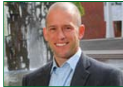
جاكوب شاپىر بۆ گولان:

ئەگەر دەولەت نۆبەراسىوونى سەربازى ئەنجامدات و هەرهەشە لە هاوولاتيانى خۆى بكات، شەرىيەتى ئەو حكومەتە دەكەوئەتتە رۆز گومانەو