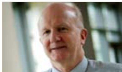
سەتئەن قان ئئەفئەر بۆ گولان:

و بەرەودان بە رەمزئەي نەتەوئەيەي بە چەشئەيئەك ھەموو كەس وەك رەمزئەي نەتەوئەيەي پيئ رازئەي بئەت، ھەرئەوئەي گرنگە ھەموو لايەك بەشدارئەي پيئكريئەت لەبەرئەي ئەوئەي ئەو رەمزانە چئە بئە، ھەرئەوئەي ئەمە بەلگەي يەكگرتنە و ئەوئەي بە جھان دەئئەت كە ئئەمە رېڭكەوتئەيئە لەسەر رەمزئەك. پيئ وايە دەيئەت نەتەوئەي لەوئەي زياتر بروات و كەلتورى خۆي دروست بكات، و ئەوئەي ديارئەي بكات كە توخمە سەرئەكەيەكانئەي كەلتورى نەتەوئەيەي چئەن، كوردەكان كەلتورى خۆيان ھەيە و پيويستە ئەوئەي بەخەنەرپوو كە ئەوان كئەن چ نەتەوئەيەكە ئەوان زمانئەي ھاوبەشئەيان ھەيە و پيئناسەيەكئەي بەرفراوانئەي كەلتورەكەيان بكەن. ناسئەوئەيئەتەوئەي سەرئەتە لە ئەوروپادا كارئەيان لەسەر پرۆژئەيەك كردد بۆ برەودان بە نووسئەيئەي كەلتورى نەتەوئەيەيان.....كئەيئەك ھەيە پيويستە بيخۆئەنەو، دەربارئەي ئەوئەيە چۆن خەلئەكانئەي دورگەكانئەي بەرئەتانبان برەويان بە رەمزئەكدا،