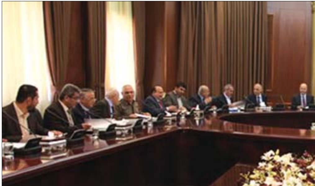
«دەتوانىن ھەموو پىلانەكان پوچەل بگەپنەو»

ھەم پىش ئەوئەى كىشە رپوئەدات دەكرپت پەنا بۇ دىپلۇماتىيەت بپرپت، ھەمىش دوای رپوئەدانى كىشەكە ھەتا ئەگەر شەپىشى لى بگەوئەتەو، كەواتە دىپلۇماتىيەت بەكارھىنناني كۆمەلپك ئامرازە بۇ كۆنترپۆل كىشەكان و خۆلادان لەدروسىتپوونى قەپران، بەلام دىپلۇماتىيەتپش بەو مەرچە كارپگەر دەپت كە بەلایەنى كەمەوئە تپگەپشەتپك لەئارادا ھەپت لەنۆوان لایەنەكان لەسەر ئەوئەى كە گرنگە چارەسەرپك بدۆزپتتەو پىش ئەوئەى مەسەلەكان لە كۆنترپۆل دەرچى، دىپلۇماسىيەت بواریكى زۆر گرنگ و زۆرپش ھەستپارە و مەرچ نپپە لەھەموو بارودۆخىك سەركەوتو و پىت لەبەرئەوئەى تەنپا لە چەند حالەتپك كارپگەرى دەپت،