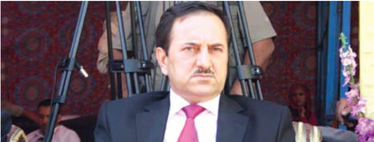
د. خيروللا حەسەن وەزىرى بازىرگانى عىراق بۇ گولان: