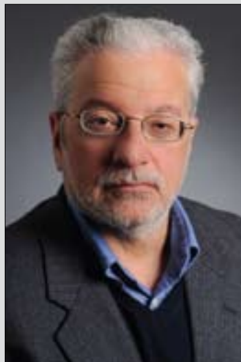
پروفېسۆر كىشەن ئافروش بۇ گولان تۆزەرى شروفا و چارەسەرى تەنگزەكان

خۇپاراستن لەشەر و كاولكارى زۆر ئاسانتەرە لە دووبارە دروستكردنهوى بېنايەك، ئەمەش پەيوەستە بەوى پىش ئەوى كىشەكە روويدات تىگەيشتن و ھەولدان بۇ رېگرتن لەو كىشەيە ھەيىت، نەك چاوەرپوان بكرىت ھەتا كىشەكە روودەدات و قەيرانىك دروست دەيىت، ھەربۆيە لەم بارودۆخەدا پىويستە ميكانزمىك ھەيىت بۇ چاودپىزىكردى ئەو قەيرانەى پىشېينى دەكرىت و ھەولبدرىت ژىرخانىك بوئىاد بىرىت بۇ ئەوى بتوانرىت لەكاتى پىويست بە بەباشى و خىرابى لەگەل كىشەكە مامەلە بكات، لەمەش گرنگتر ئەويە كە پىويستە ئىرادەيەك ھەيىت بۇ ئىدارەى تەنگزەكە، بۇ ئەوى ئەم ئىرادەيە بىيئە ھاندەرىك بۇ چارەسەركردى قەيرانەكە.. سەبارەت بە قەيرانى ئىستاي عىراق لاي من جوانترىن وتە كە تائىستا گوتراو ئەو وتەى كۆلن پاولە (وھزىرى پىشوووى دەرەوى ئەمىرىكا) كاتىك بەزمانىكى سادە لە سوپەرماركىتتىكدا مەسەلەى دەستپورەدانى ئەمىرىكاى بۇ كەسىكى ئاسايى روونكردۆتەو و پىي وتوو (ئەگەر ھەر شتىك لەم سوپەر ماركىتە بشكىنى پىويستە لەسەرت بىكرىت و پارەكەى بەدى)، بەداخوہ ئەمىرىكا بە