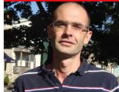
رۆبين زايوتى بۇ گولان:

ئەگەر بېت و سنوورېك بۇ مالىكى دانەنرېت يان لانى كەم ناچار نەكرېت بگەرېتتەو بۇ دىالوگ و چارەسەر كىشەكان بەرېنگە ئاشتى و دەستورى، ئەوا مە حالە ئەمجارە بتوانرېت رېگە لە كۆتايى عېراق بگېرېت