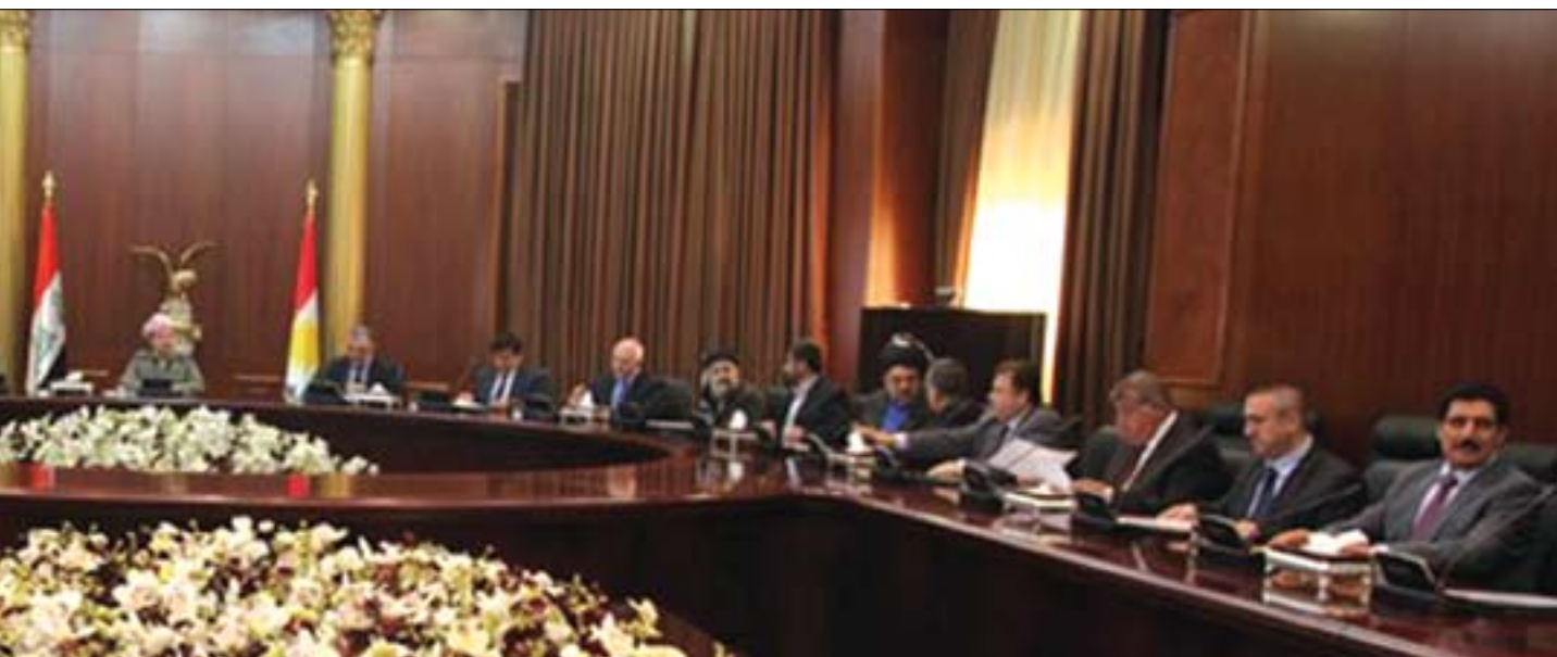
«كۆبونەوھى لايەنە سىياسىيەكانى كوردستان باشتىن و بەھىترىن وەلام بوو بۆ پىلانەكانى دژ بە كوردستان. ھەر لەسەر ئەو يەكرىزى و يەك ھەلۋىستىيە»

خىرە ناوخۆبىيە ھەبىت كە دەبانەوئەت رېگە لە كىشە بگرن و قەيرانئىكى گەورە دروست نەبىت، بۆيە لەم راستەو ئەگەر پىشتر دىپلۇماتىيەتى خۆلادان لە كىشە يان خۆپاراستن لە تەنگزەكان ھەولئىكى ناوخۆبى لايەنە پىكناكۆك و ھاوژەكان بووئىت، ئەوا لە ئىستادا ئەمە بۆتە ھەولئىكى ئىئودەولەتتى و دەبىت كۆمەلگەى ئىئودەولەتتى لەسەر دوو ئاست ھەماھەنگ بىت بۆ رۋوبەروو بونەوھى تەنگزەكان: ۱- لەسەر ئاستى داننان بەبوونى كىشەكە. ۲- لەسەر ئاستى چۆنىيەتى رۋوبەروو بونەوھى كىشەكان و چۆنىيەتى مامەلەكەردن لەگەل تەنگزەكاندا.