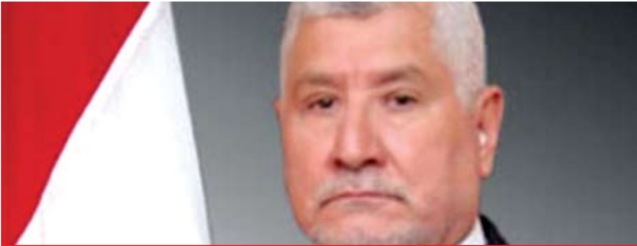
دیندار دۆسكى وەزیری كۆچ و كۆچبەرانى عیراق بۇ گولان: