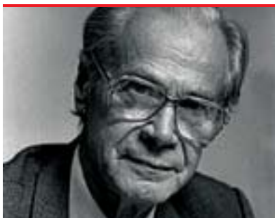
دېنيس دى جەي سالدۆم بۇ گولان: