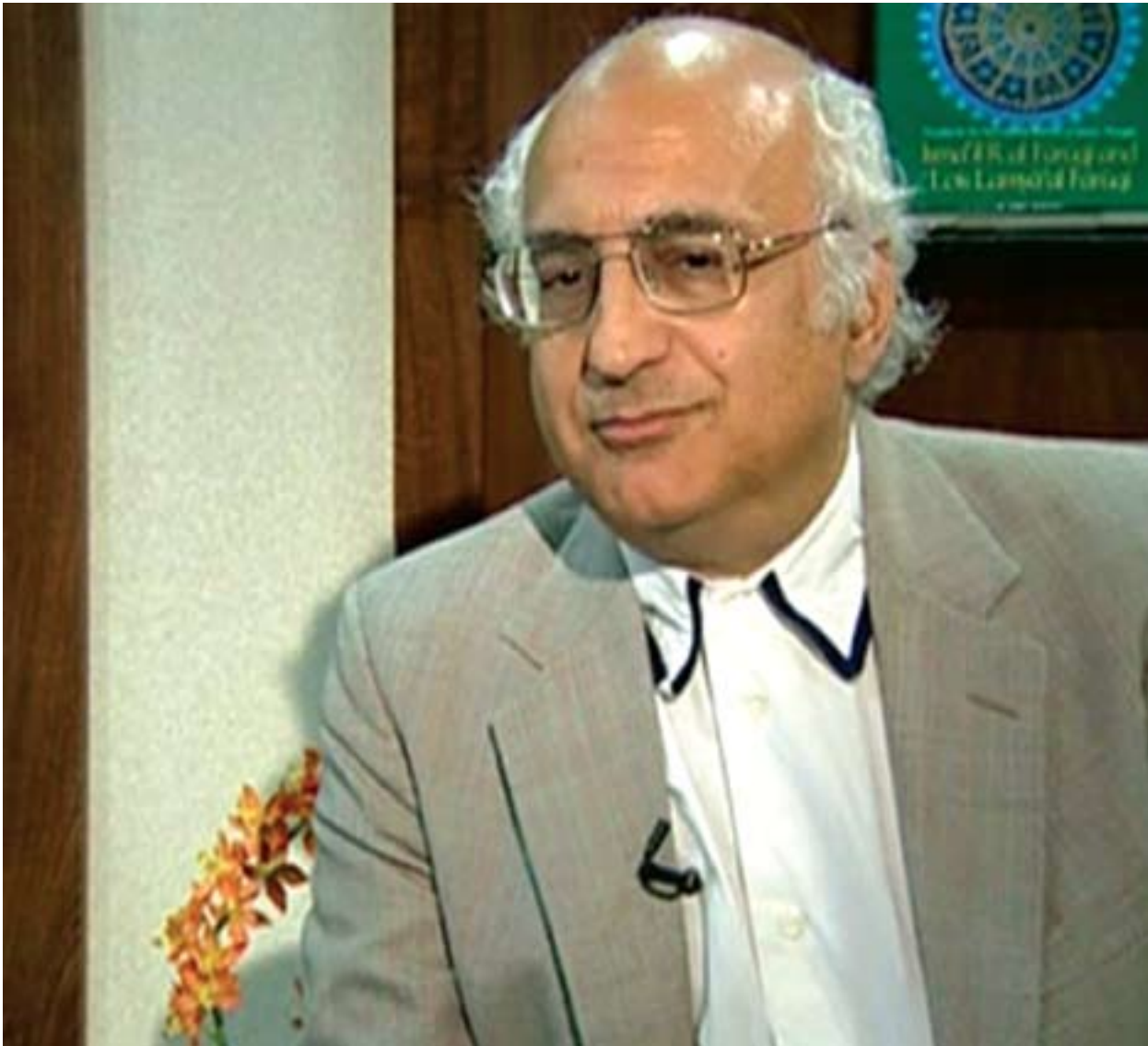
عيمادهدين ئەحمەد بۆ گولان: