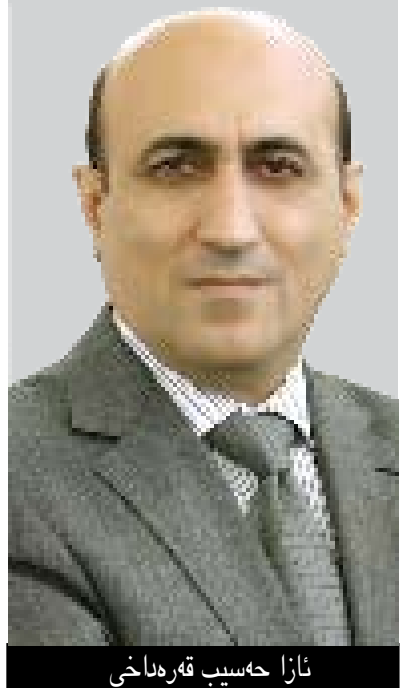
ئازا حەسب قەرەداخی نو ھەفتە جاریک بۆ گولانی لەنووسیت

عێراق تەنیا لەو کاتاندا لە رۆخی ناسنامەیی دەوڵەت نزیکبوو ئەو کە بێر لە دیموکراسی کردنی قەوارەکە و جۆری حکومرانی تێتیی و بەخشینی ناسنامەیی ھاوولاتی ھاوشان کراوەتەو کە بەریتە ھەموو ھاوولاتیانی نیشتەجیی ئەم دەوڵەتە. ئەم دەورانانە لە رووی ژمارەو زۆر کەم و لە رووی کاتەو زۆر کورتخایەن بوون. دەنا سەریقی میژووی ئەم دەوڵەتە ھەمیشە لە چەقی نادەوڵەتیدا بوو و بە شیوای جۆراو جۆر و جیاواز لە ناست و بیری توندوتیژیدا گوزارشتی لە نادەوڵەتیی خۆی کردوو. تا گەیاندووبەتییە ئەو رادەیی بە زۆر ناسنامەیی نەتەو و ئایینی رەسەنی لە بەشیک لە ھاوولاتیانی خۆی سەندۆتەو و ناسنامەیی دیکەیی بەسەریاندا سەپاندوو. تا گەشتوو بەو رادەیی ئەوانەیی ئەمەیان قبول نەکردوو