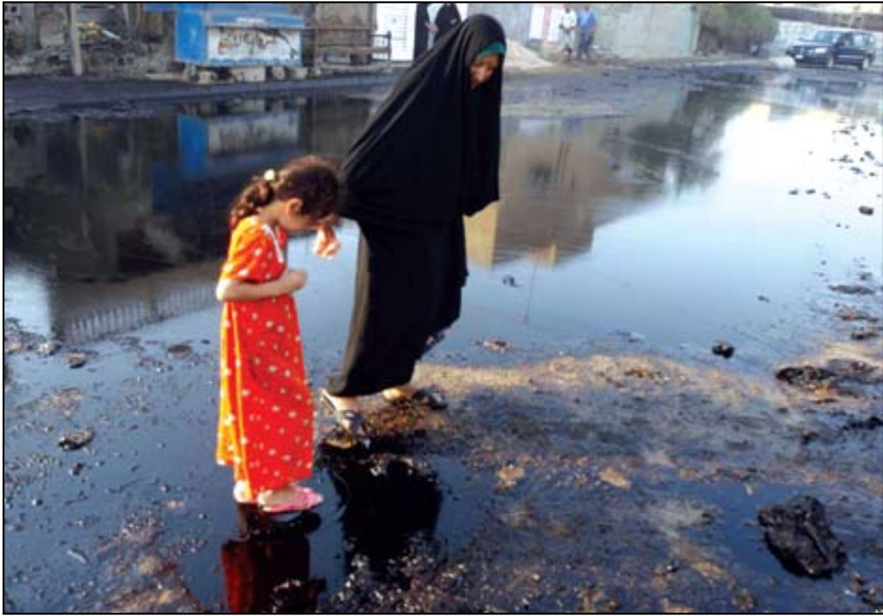
بەغدا سێم پائتەختی پیسی جیهانە

سەرەکی دابین بکات، بەلام گریبەستی چەک کڕین بە چەندین ملیار ئیمزا دەکات و پائتەختە کەشی بە پێی راپۆرتی یونیسکو یەکیکە لەسەر پائتەختە پیسەکانی جیهان.