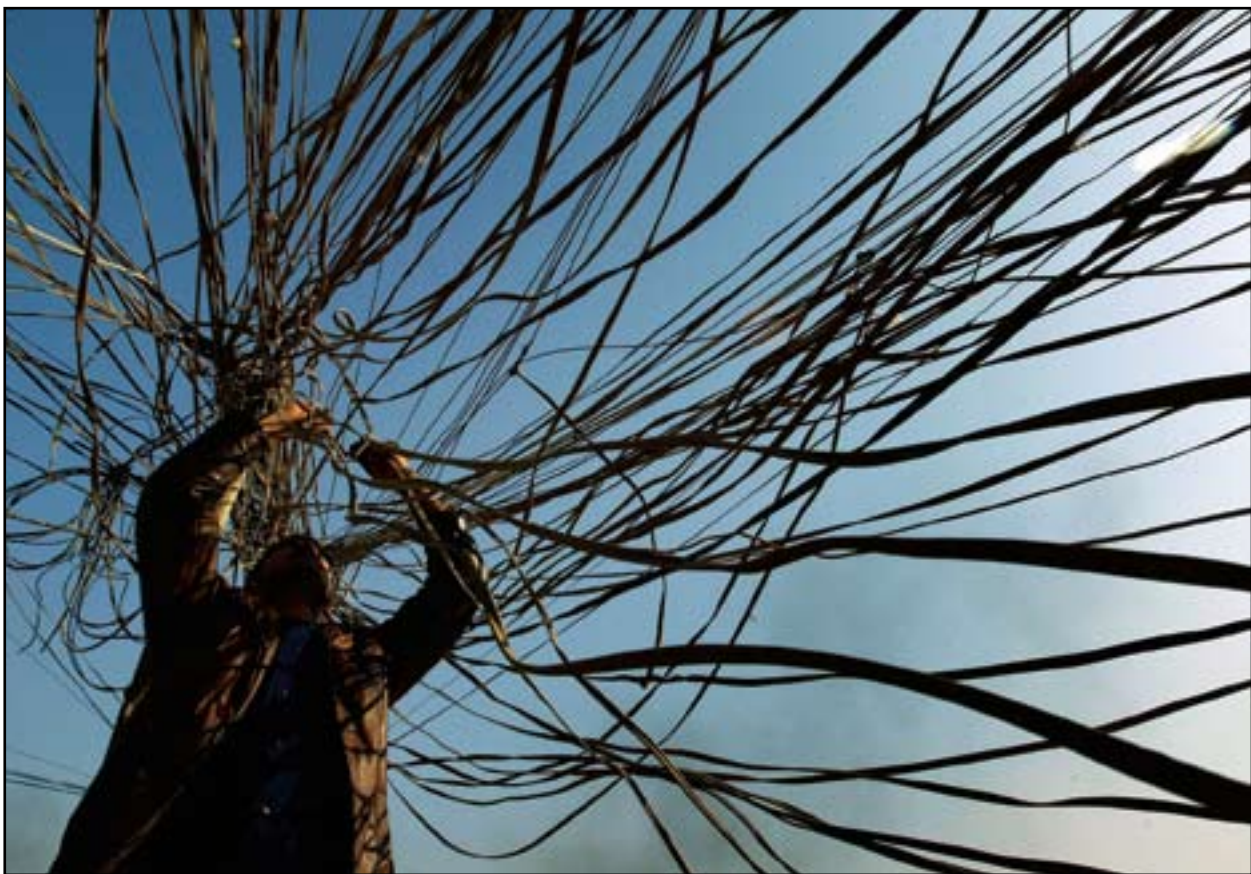
ئەمىيە تۇرى كارىباى نىشمانى لى عىراق

۳- سەرۆك وەزىران سەربەخۆيى دادگاي نەھىشتوو و ئىستا دادگايانى كىردوو بە ھۆكارىك بۇ تەسفىيە كىردى نەيارەكانى . ۴- شەخسى خۆى كۆنترۆلى ھىزەكانى ناسايىش و سوپاي كىردوو. ۵- رۆلى رىكخراوەكانى كۆمەلگەى مەدەنى نەھىشتوو و دەكرى بلىين بلۆكى كىردوو. ۶- وەك ھەموو لايەك ھەستى پىدەكەن و تەنەت رۆژنامەنوسان و چاودپرانى بىيانىش ئامازەى پىدەكەن و لەمىدياكانى جىھان بلاوى دەكەنەو، نورى مالىكى حكومەتى كىردۆتە حكومەتى جزىك تەنيا لەگەل بەشىكى مەزھەپىدا كاردەكات كە ئەویش مەزھەبى شىعەيە، ئەمەش واپىكردوو بەشىك لەناو مەزھەبى شىعە و ھەرەھا عەربى سوننە و كورد ھەست بىكەن پەراوئى خراون. ۷- حكومەتى مالىكى و دارودەستەكەى ئەوھىان نەشاردۆتەو و راشكاوانە ئەم حالەتە بە بەغداوە ديارە، ھەر كەسىك ئەندامى