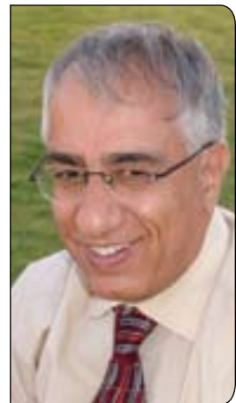
لکتور شيرزاد نه جار* تاييه ت بۆر گولان نووسيويتي

له سه ده ي هه زديه مه وه بواري گشتي نو خه سه له تيکي ناوازه ي وه رگرتووه هه ر له و کاته وه به (شوينگه ي پيوه ندى زمانه واني) ناوزه دکراو، وتوويزي کي زوري له باره وه نه نجام دراوه، چونکه زمان رولي کي ناوازه ي تيدا گيراوه، له شوينه گشتيه کان گفتوگو کردن له نيوان خه لکيدا ده ستي پيکردووه له سه ده ي نو زديه مه وه وه ش نه م دوخه وه رچه رخانيني له نامراره کاني گه ياندى و ماسميديا کاند ليکه وتوتسه وه، به تاييه تيش له ريگه ي هويه کاني راگه ياندى نووسراوه وه، دواتریش له سه ده ي بيسته مه وه به هوي هويه کاني راگه ياندى ئيلکترونييه وه زياتر په رى پيدرا.. نه م فراوانبووني رووبه رى ئيلکترونييه، له سوئنگه ي روانينه کاني هابرماسه وه هاوکوف نه بوو به گه شيبيني له ئاست بواري پيوه نديه سياسيه کان، به پيچه وانوه نه م به ر فراوانيه ي هويه کاني ئيلکتروني ته شه نه ي کردووه بووه به هويه ک بو دارماني بواري گشتي سياسي Niedergang der politischen Oeffentlichkeit جه ماوهرى ده سته بزي عه قلاني raesonierende Publikum گوريوه بو جه ماوهر ي کي به کاربه رى