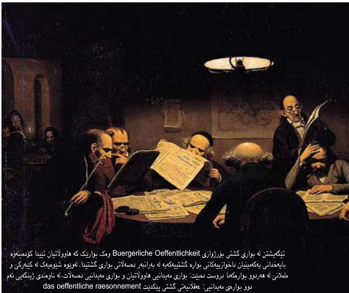
تیگه‌ه‌شتن له‌ بواری گشتی بۆرژوازی Burgerliche Oeffentlichkeit وه‌ک‌ بواریک‌ که‌ هاوولاتیان‌ تیندا‌ کۆده‌بنه‌وه‌ بایه‌خدانی یه‌که‌مینیان‌ ناخوارییه‌کانی‌ بواره‌ گشتیه‌که‌یه‌ له‌ به‌رانه‌ر‌ ده‌سه‌لاتی‌ بواری‌ گشتیدا، له‌ویوه‌ شێوه‌یه‌ک‌ له‌ کێبه‌رکی‌ و‌ ململانی‌ له‌ هه‌روو‌ بواره‌که‌نا‌ دروست‌ ده‌بیت: بواری‌ مه‌یدانی‌ هاوولاتیان‌ و‌ بواری‌ مه‌یدانی‌ ده‌سه‌لات. له‌ ناوه‌ندی‌ ژینگه‌یی‌ ئەم‌ نوو‌ بواری‌ مه‌یدانی: عه‌قلانیته‌ی‌ گشتی‌ پینکیت‌ das oeffentliche raesonnement

رای گشتیی گوزارشت له‌ رای ناهه‌رمیی ده‌کات، به‌لام‌ ناشچینه‌ چوارچۆیه‌ی بونیاتانی پرۆسه‌ی دروستکردنی راوێچوونه‌وه‌، واته‌ پیکه‌وه‌ ویکنایه‌ته‌وه‌و لیکنابه‌سترینه‌وه‌