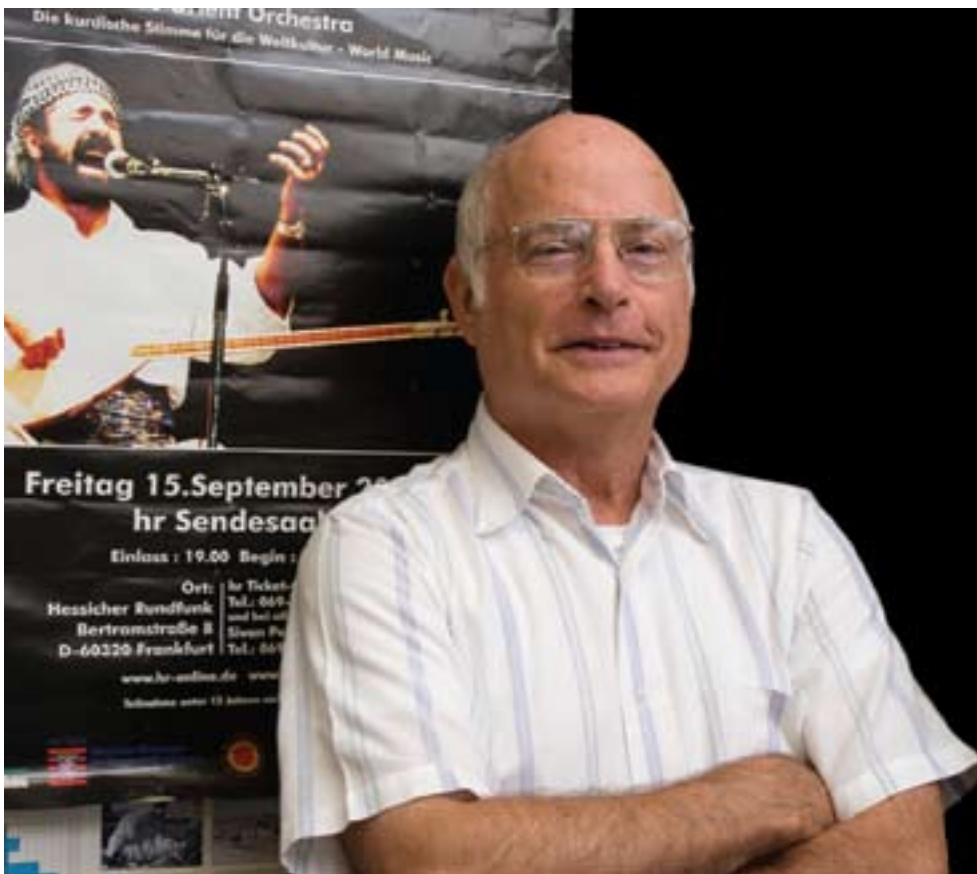
پروفیسور مایکل گھنتز تائبەت بۇ گولانی نووسیووہ

لایەنە بەغدا بیٹ، چونکہ ئەو کاتە ئەمریکا و ڕەنگە تورکیاش کاردانەویان ھەبێت بۆ پاراستنی ھەرێمی کوردستان، لەبەر ئەوەی ئەمە لە بەرژووەندیاندا دەبیٹ. لەو ھەوش زیاتر، ھەمیشە ئەوەتان لە یاد بیٹ کە کوردستان وەک ھەرێمیکی فیدرالی لێ چوارچۆی عێراقدا، ھەموو ئیختیاریەکانی سەرەخۆی ھەیە بۆ ئەوەی دووچارێ دژواریەکانی بیئەو.