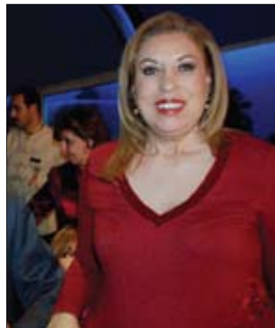
ئەفكار ئەلخەرادلى بۇ گولان:

ياساناس و راوئىزكار مەحمود ئەلخزەيرى پرسىار دەكات، ئايا مىسر لەبارىدا نىيە دەستورېك بنووسىت كە بە دلى ھەموو توئزەكانى گەل بىت، دووپاتىشى دەكاتەو