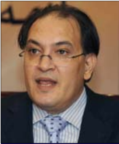
حافظ ھبوع سوعده بو گولان:

رەشنووسەكە بریتییە لە خراپترین دەستوور كە تانیستا میسر بەخوێوەدیوه، بە توندیش رەخنەى گرت لەو ناكۆکییانەى لە دووتویى ماددەكانى نیو دەستوورەكەدا بەرچاودەكەویت، چونكە لە بەهاو پرەنسیپەكانى مافى مرؤفا كەم دەكاتەووە پریپەتی لە تەلەى دەستووری و یاسایی