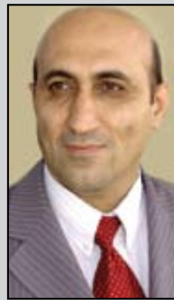
نازا ھەسەب قەرەداخى

لە قۇناغى ئىستاي پاشى روۋخانى شۇ فېنېترىن حوكمراينەكانى مېتۇرى ھاۋچەرخى ئەم دەۋلەتەكېشەبە، دىسانەۋە ھەمان ئەۋ كېشە گىشتىگىرە دەرەكەوتۇتەۋە و حوكمراينى نوى بەرگى نوى لەبەر دەكەن. ئەگەر جارى جاران بىچ ھىچ دەستورنك، بۇ پاراستنى ناسايش و بەھا بالاكانى ئوممەى عەرەبى بەتوندى لە دوژمنە ناۋخۇبىيەكانى دەدرا كە كورد لەپېشەۋەى ھەموۋىيان بوۋ، ئەۋا ئەمىرۇ بەناۋى پاراستنى دەستورەۋە نەخشە بۇ ھەمان لىدان دادەرپۇزى. لىدانىك كە سەرەتاكانى برىتىن لە