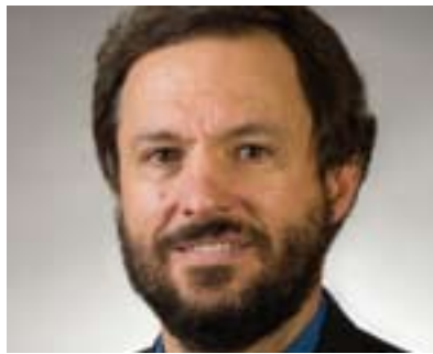
ستیفن زۆنەس بۆ گولان:

ئەمە یە گریمانەکان لە ئەمریکا لەبارە ی کەیسەکی سوری پاش ھەلبژاردنەکان.. وێرایی ھەموو ئەمانەش کەس نازانیت ئەنجامی ھەلبژاردنەکان چییە، بەلام ئومیدیکی ھەیە کە ئەگەر ھات و ئۆباما ھەلبژاردنەکانی بردەو ئەو ئەوکات ئۆباما زیاتر سەربەست دەبیت و بواری زیاتری بۆ دەرەخسیت بۆ ئەو لە خولی دوو میدا لە