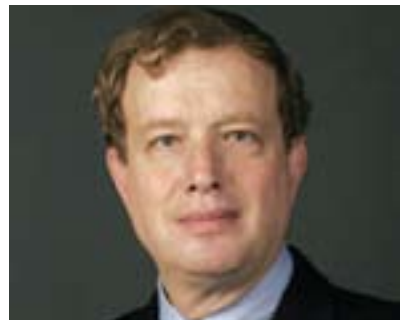
تۆماس شوارتز بۆ گولان:

دەيىت ھەول و كۆششىكى زۆر بەدات بۆ كۆنترۆللى دىنامىيەكەتى ئالۆزى دواى بەھارى عەرەب. لەبەرچاۋگرتنى ئەوئى وترا، ئەو ھالى حازر ئىدارەى ئۆباما وزەيەكى زۆرى خستۆتەگەر لە ھەلئۆرئەدا بۆ مامەلەكردن لەگەل ئەو ئالوگۆرەى دروست بوو بە ئاراستەى پىكھاتنى حكومەتە ئىسلامىيەكان لە ناوچەكەدا).