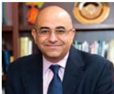
سەمەر شەحەتە بۆ گولان:

پروفیسۆر سەمەر شەحەتەش ھەر سەبارەت بەم لایەنە و سىياسەتى ئەمريكا بەرامبەر عىراق و ھەرىكى كوردستان وای دەبىيىت ئەمريكا لەشەرى عىراق سەرکەتوو نەبوو و پىناچىت بەرامبەر عىراقىش گۆرانكارىيەكى ئەوتۆى بەسەردا بىت، لەمبارەوہ و لەدرىژەي لىدوانەكەيدا بۆ گولان بەمجۆرە راى خۆى دەبرى:)