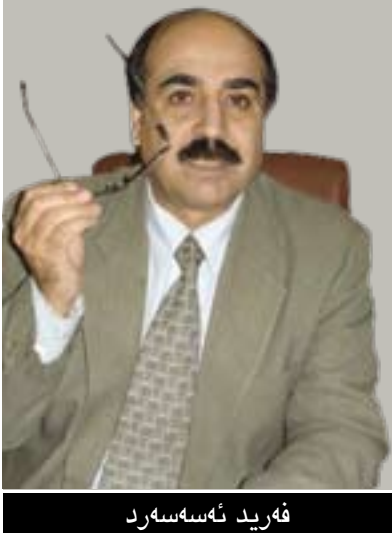
فەرید ئەسەسەرد بۆ گولان نووسیبوی

لە ئیسلامدا سەلەفی بزوتنەویەکی نامۆ نییە، بەلام مێژوی پەیدا بوونی روون نییە. زۆرتر پێدەچێ بەشێویەکی سەرەتایی لەسەردەمی ئەمەویەکاندا پەیدا بووین و وردتیش پێدەچێ لە سەرویهندی ئەمانی یەکەم ئەوێ ئیسلام کە تا کەکانی لەمێژوودا بەسەحابە ناسراون، پەیدا بووین. ئەو پەيوەندییە تایبەتە کە بزوتنەوی سەلەفی بەنەوی یەکەمی ئیسلامەو هەبەتی، کۆرۆکی بزوتنەوه کە پینکدینت. لەسەردەمی عەباسیەکاندا بزوتنەوه کە چوارچۆنیەکی گشتی بۆ بیروباوەرەکانی پیکهینا، بەلام نەیتوانی تێر وانیکی رۆشن بۆ هەموو مەسەلەکان گەلەلە بکات، هەر وەك نەشیتوانی سەرکردایەتیەکی یەکگرتوو پیک بێت. زۆریە کات وەك بزوتنەویەکی نایینی - کۆمەلایەتی هەلسۆکەوتی کردو هیچ رۆلێکی سیاسی گەورە نەتواندو لە جیهانی نییەکی داخراودا ژیا.