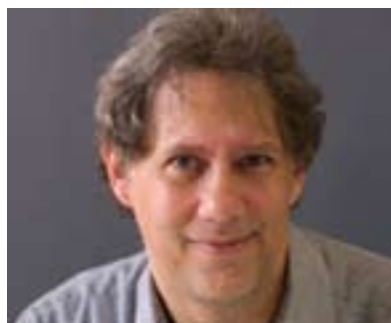
دىقىد مېدنىكۇف بۇ گولان:

سىياسەتى خۇى لەسەر ئاستى نېۋەولەتى پىادە بىكات، كە گۇرېنى ئىدارەى ئەمرىكى لە كۆمارىيەكان بۇ ديموكراتى و بەپېچەۋانەشەۋە كارىگەرى لەسەر شىۋازى پېۋەندىيەكان نەيىت، لېرەدا جىگەى خۇيەتى ھەلپۇردنەكانى سالى ۲۰۰۸ و ھەلپۇرئەت توركىيا بەرامبەر ئەۋ ھەلپۇردنە بەپېرېئىنەۋە كەۋەك ئەۋبۇو ھەلپۇردنە تايىبەت يىت بەتوركىيا و بەھەلپۇردنى ئۇباما لەھەموو شارەكانى توركىيا ئاھەنگ گىرېدرا، بەلام لەھەمانكاتدا ھەرىمى