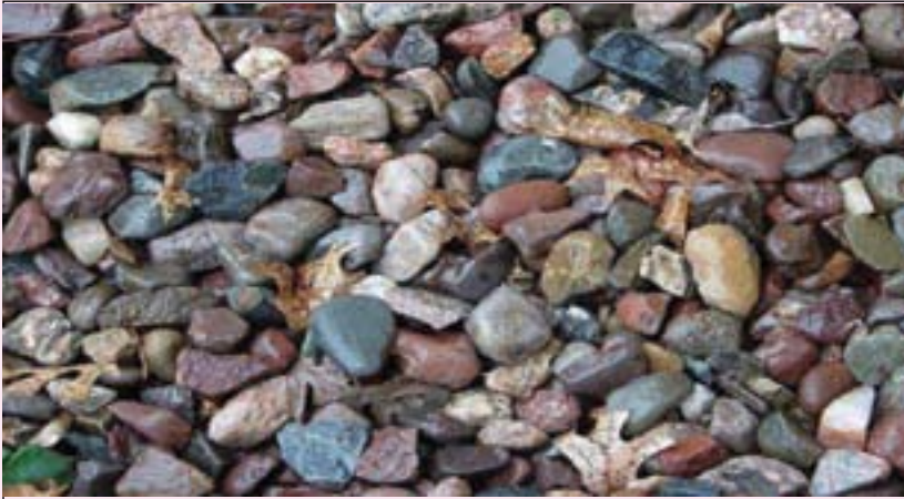
لەم وینەیه بۆقیك هەیه بیدۆزنهوه