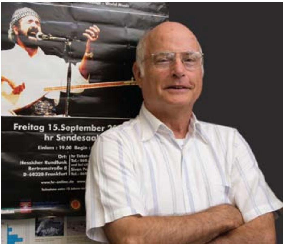
پروفیسور مایکل گولان تایبہت بۇ گولانی نووسیووہ

خاوهنى فرۇكەخانەى نۆۋدەلەتتى و سىستىمى پەرودەيى خۇيەتتى، كە تەننەت كەسانىكى كەمىك ئەو ئەركە دەخەنەبەر خۇيان بۇ ئەوئەى فېرى زمانسى عەرەبى بن، ھەرودھا تەننەت مۇرى خۇى لە پەساپۇرتى ئەو كەسانە دەدات كە سەردانى ھەرئەمەكە دەكەن.