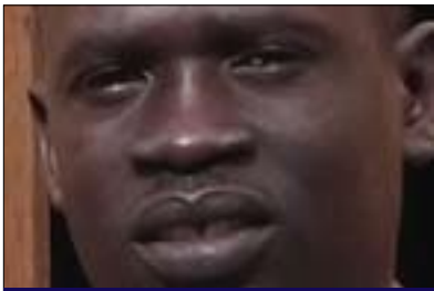
شول تون ملوال:

ھەرس پىن . وىزى راستى ئەم شەرقەكردنە مەجھوب محمد سالىھ پىي وايە كە سودان ھەمىشە تواناى ئەوئى دەبىت ئىدارەى قەيرانەكان بىكات، بەلام چاودېرى ئىئودەولتەتى و ھەرىكى كاردانەوئى دەبىت لەسەر جىبەجىكرىدىنى رېگەوتنەكە، بۆيە رېگەوتنامەكان گۆرانكارى رادىكالى لە پىئودىيە ھەردوو ولات دىننەئاراو، لەقۇناغى شەھىرى پىكىدادانەو دىتە ئىو چوارگوشەى ھاوكارى و پىئودىيە دراوسىيەتى شان بەشانى جىبەجىكرىدىنى تەواوى رېگەوتنەكە، بەلام پىئوسىتە رەچارى ئەو پرس و كىشە مەتسىدارانە بىرېت و چارەسەريان بۆ بدۆزىتەو، كەخۇى لە كىشەكانى سەرسووردا دەبىنېتەو، لەكۆتايىدا دەلېت: پىشەبى ياساوپرۆتۆكۆلەكان يارمەتىمان نادات نە كىشەى ئىيەى و نە كىشەى سنوور چارەسەر بىت، بۆيە پىئوسىتە دانوستانكاران بۆچوونىكى تازەبىان ھەبىت و بەدوام چارەسەر و سىياسەتى تەواوكارىدا بگەپىن بۆ ئەواناچانە، ھاوكات بەرژوئەندىيە ھۆزەكان رەچارىبىرېت بەرنامەيەكى چروپەر داپرېژرېت بۆ پىشەكەشكرىدىنى خىزمەتگوزارى ھىتانەكايەى گەشەسەندىكى بەردەوام بۆ خەلكى ناوچەكە، ھەررەھا ئەو كەشووھەوايەى كە پىئوسىتە دەستەبەربىرېت كە يەكەم جار بۆ گۆرانكارىيەكى رىشەبى بىت ئىنجا جىبەجىكرىدىنى دوا رېگەوتن كە تاقىكرىدەوئەبەكە بۆ راستى و متمانەى ھەردوولا.