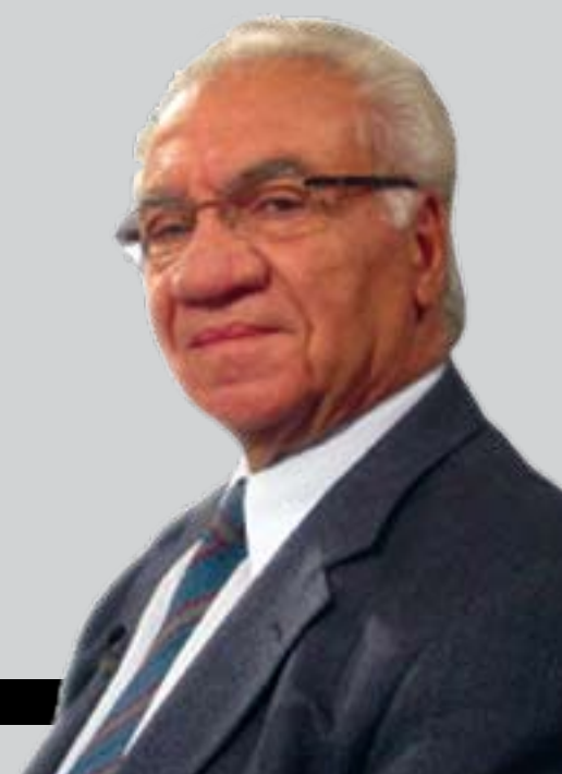
کازم حەیب تاییبەت بۆ کولان نووسییوتی

۶- زیندەبوونی کاریگەریی سیاسی کلتووری نابهجیی مالکی و حزبهکی و رەنگدانەوهی له هەلسۆکەوتی نالەباری کۆمەلایەتی بەرامبەر ریکخراوهکانی