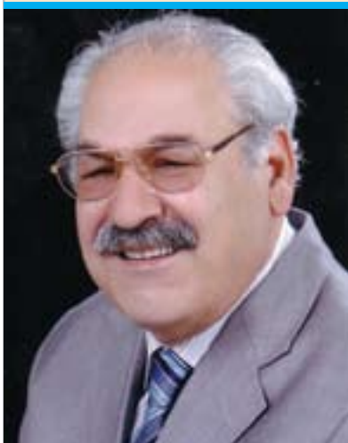
فهلهکه دین کاکهیی

وه لی من واژهی بههاره به لایه کی دیکه دا پینشان دههه، که بههاریکی کوردی دهستی پیکردوهه، نهویش بیدار بوونه وهی گشتگیری نه ته وهییه، که چاوی برپوهته رزگاری و