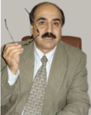
فەرىد ئەسەسەرد بۇ گولان نووسىۋىتى

ئىسلامىيە پرەگماتىيەكان، بەتايىبەتى گروپىي ئىخۋان مولىمىن لەمىسرو بزۋوتنەۋەي نەزە لەتونىس، نكولى ئەۋە ناكەن كە لەروۋى ئايدىۋولۇژىيەۋە خۇيان و سەلەفىيەكان لەيەك سەرچاۋە ناۋ دەخۇنەۋە