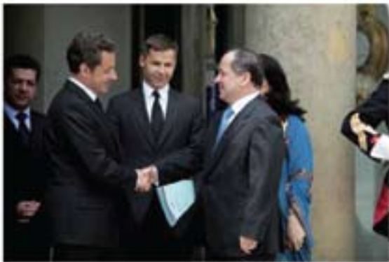
President Massoud Barzani with former French president Nicolas Sarkozy at the Elysée Palace on 12 th June 2012.

wants to solve this issue then it knows what to do... Otherwise, all options are being considered". Following in the footsteps of Alexander the Great, Massoud Barzani seems to be patiently sharpening his blade, in order to cut this legal and political knot when the time is right. Indeed, the considerable strategic stakes that lie within the Kirkuk situation are not without similarities to the fate of Ottoman Mosul in the wake of the First World War. Legally, this issue was never settled, not even during the brief existence of an independent Kurdistan, grasped from Saddam Hussein by Mustafa Barzani in the early 1970s. Meanwhile, the Kurds - and President Barzani in particular - have shown great patience and the ability to recover from the most acute disappointments, betrayals, and denials.