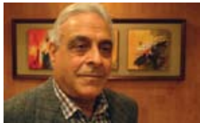
موفىد جەزائىرى بۇ گولان:

سىتراتىيەي عىراقى ئەم مەسەلەيە بە شىۋەيەكى دىكە سەير دەكات و پىۋاۋەيە كە رووخانى پۇرۇمى ئەسەد كۇي ھاۋكىشە سىياسىيەكە دەگۇرۇت، لەمبارەۋە لەلېۋانىكى تايبەت بە گولان بەمجۇرە ھاتتە ناخاۋتن: (كەيسى سوريا مەترسىيە زۇر گەۋەي لى دەكرىت و ئە گەرى ئەۋە ھەيە كارىگەرى لەسەر زۇرەي ولاتەكان ھەيىت، بەراي من كەيسى سوريا لەھەمۇۋ كەيسەكانى دىكەي بەھارى عەرەبى جىاۋازە، لەبەرئەۋەي سى مەسەلەيە زۇر گىرنگ لە كەيسەكەي سوريا- دا ھەيە، يەكەمىان: چەمكى ھاۋسەنگىي ھىزەكان كە لەسالى ۱۹۹۱-۱۹۹۰ ھە دەستمانداۋە، ئىۋەپىش لەۋە بەئىگان كە ھەر لە ۱۹۶۵-۱۹۶۰ ھە تاكو