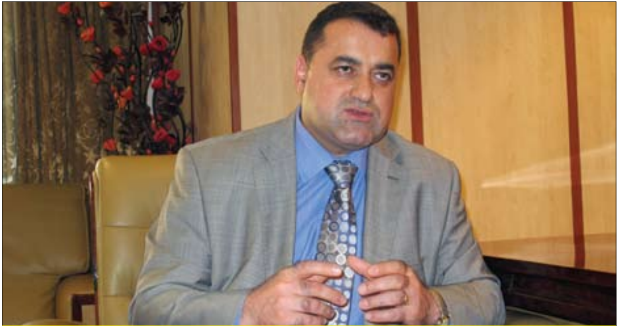
جونسون سیاویش ئەیۆ وەزیری گواستەووە گەیاندن بۆ (گولان):