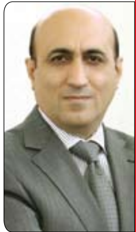
ئازا جەسەب قەرەداخى

ھەرچەندە ھەقە بزوتتەنە ھەقە ئايىنى بوو، ولئى ناوات و ئامانجەكانى دامەزىنەران و شۈينكەوتوانى زۆرتر پىۋىستىيە ماتريال و ژيارىيەكان بوو، كە گوزارشت لە پىۋىستىيە ژىنوارىيەكانى كۆمەلگايەكى جووتىيارى دەكەن