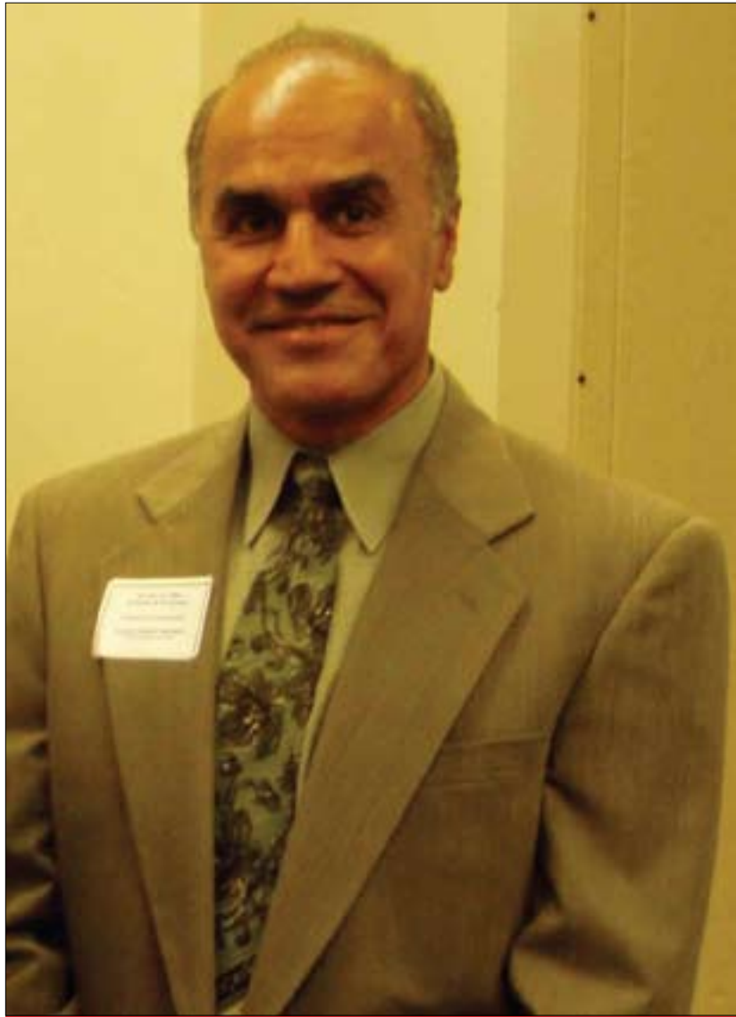
مەنسورى موعەدەل بۇ گولان:

- دەكرىت لەرپى بەھىزكردنى رىكخراوہكانى ئافرەتەن و رىكخراوہكانسى كۆمەلگەى