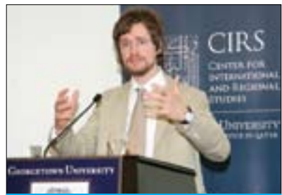
د. مايكل دريزن بۆ گولان:

هاته ناخوتن: (شه گهر ئۆپوزسيون و شهوه چه كدارانه ي ئىستا له ناو سوريا شه ر له گه ل شهسه د ده كمن بتوانن شوئنى زياتر كۆنترۆل بكن، شهوا له وانيه بارودوخه كه وهك لىبىاى لى بپت، بهلام ده بپت ليره دا ره چاوى شهوه بكه ين، كه شه م بارودوخه به و خيزايه نايتت كه له لىبىا رويدا، كاتى زياترى ده وپت، شه مه ش زه مينه خو ش ده كات بۆ شه وه ي كۆمهلكه گى نيودهولته تى زياتر پشترى ئۆپوزسيون بكات يان هه ولئيدات ده ستيوهردان بكات، كارنىكى له مجوره ش پيويستى به ره زامه ندى روسيا هه يه، راسته روسيا به ئاشكرا شه ره زامه ندىه ده رنابرېت، بهلام رهنگه به نه يئنى و شه وىش دواى شه وه ي زه مانه تى به ره شه وه ندىه كانى