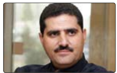
شۆمەر توفیق لويس بۆ گولان:

بنەمای دولەتسى ئایینی بونیا دەنێن، بۆیە ئەگەر ئەم هەنگاوى رەوتە سیاسیه ئیسلامیهكان فێلیك بێت بە بەكارهێنانى میكانیزمەكانى دیموكراتى بگەن دەسلەلات و دواى گەشتنە دەسلەلاتیش دولەتسى مەدەنى بگۆرن بۆ دولەتسى ئایینی، سەبارەت بەم لایەنە كە چەند مانگیگ لەمەوپێش لەدیمانەیهكى تایبەتدا ئەم پرسەمان رۆوبەرپرووی بیرمەندى گەورەى عەرەب محەمەد سەبیلا كردهوه، ئەو لەولامى گولاندا ئامازەى بەوه كرد، دەبێت چاوەڕێ بكەین بزاینن تاچەند ئەم رەوتە ئیسلامیانە دەتوانن خۆیان لەگەڵ مەفھومی دیموكراتى بگونجین، بۆ ئەم راپۆرتەش پرسیارمان لەپروفسۆر عیقادەدین ئەحمەد سەرۆكى سەنتەرى منارە بۆ ئازادى (minaret of freedom institute) كرد و ئەویش لەولامى ئەم پرسیارەدا بەمجۆرە بۆ گولان هاتە ناخوتن و گوتى: (بۆچوونى من لەسەر ئەم پرسە پشت بەدوو روانگە دەبەستێت، یەكەمیان بەهۆى پێوەندیهكەمەوه لەناوچەكەدا ئاگادارى بارودۆخەكەم، دووهمیشان پشت دەبەستێت بە راپرسیهكانى دەزگای گالۆپ لەناوچەكەدا، ئەم دوو بۆچوونە یەك مەسەلە پشتراست دەكەنەوه، ئەویش ئەویە ئەم ولاتانەدا دوو تەوژم و ئاراستە هەن كە زۆر بەیهكداچوونە، لەلایەكەوه ئارەزوویەك هەیە بۆ پێكھێنانى حكومەت لەسەر بنەمای ئایین و لەلایەكەوه خواستى دیموكراسى هەیە، بەلام بە ئەندازەیهك ئەم بەیهكداچوونە كە زۆرێك لەعەلمانییەكانسى رۆژئاوا ناتوانن جیاوازیەكە بەدى بكەن و لەرەگ و ریشەى قولی ئایین