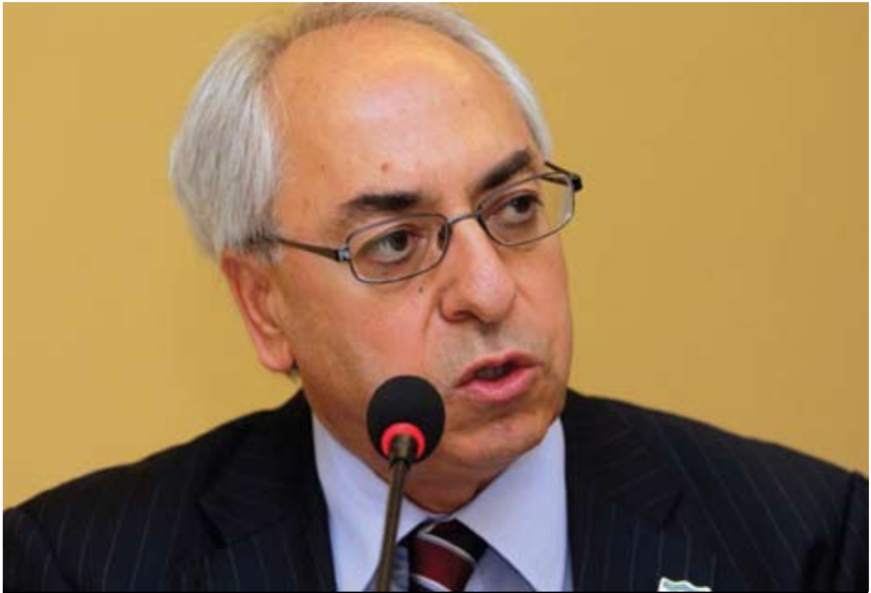
عبدالباست سەيدا سەرۆكى ئەنجومەنى نىشتمانى سوریا بۆ گولان: