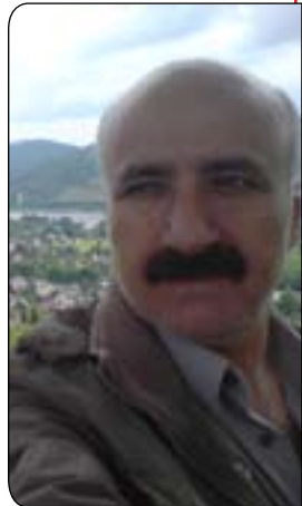
جەزای شیخ رەزا - ئەلمانیا

«سوسرا دەروازی دەریایی نایە، چوار دەور گیراوە بەو ولاتانە ی لەگەڵ یەكدا دەجەنگن، راگرتنی بێلایەنی ئابوری لەکاتی جەنگدا کارێکی هێجگار سەخت بوو، لەوێش قورستر راگرتنی بێلایەنی مۆرالی بوو. لە ولاتە کەدا هیچکات نەتوانراوە ئەوەندە دانەوێلە بەرەم بەهێزێت کە بەشی پێداووستی ژبانی خەلکی بکات. لەو کاتی جەنگدا هەموو کاروباری بازرگانی کەوتە ژێر دەستی و دزارتی دەرەو، کە توانی سیاسەتیکی سەرکەوتوو پێدا بکات ئەویش بەدروستکردنی دوو کۆمیتە ی بازرگانی سەرەخۆی