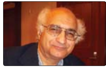
عيماده دين ئەحمه د بۇ گولان:

موسلمانه كانيشه وه. شه گهر له ميژووی شه مريكا بروائين، شه وا زۆريك له پارته سياسيه كان خهلفيه تيكي نايینی به هيزيان هه بوو، بزوتنه وهی دژه كۆيلايه تی... ئەم بزوتنه وانه راسته وخۆ و ناراسته وخۆ نايين جۆشه دريان بوو، واته له لايه ن كه سايه تيه نايينييه كان بالاده ستبوون، ته نه ات بزوتنه وهی مافه مه ده نييه كانيش له سالانی شه سه ته كاندا، بۆ نمونه مارتن لؤسه ر كينگ، كه واته ناييت چاوه رپي جياكرده وهی نايين له بزوتنه وهی سياسی بكه يت، پرسياره كه شه وهيه نيا كاتيك پارتنيكي سياسی له ده سه لاتدا ده بيت خو ی به خزه مته كار و نيونه ری سه رجه م خهلك ده زانيت، ياخود خو ی به نوينه ری هه ندی گروهی نايینی كۆمه لگه ده زانيت، هه ر شه مه ش هۆكاری شه وهيه كه ئەم حكومه تانه ی بهم دواييه له ولا تانی عه ره بيدا پيپه كاتن ناتوان نايینی و ديموكراسی بن، بهلام كاريكي باش