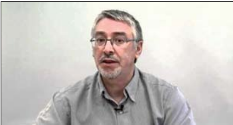
جەي ئەلېستەر ماگريگور بۇ گولان: