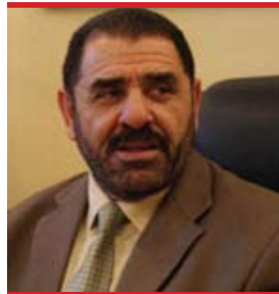
موتەشەر سامەرائی بۆ گولان:

تا ئیستا ئێران و ئەمریکا پالپشتی لە مانەوێ مالیکی دەکن