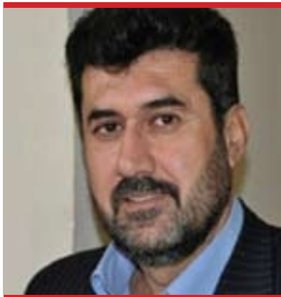
ئوسامە جەمیل بۆ گولان:

و بۆ هەموو لایەنەکان وەک یەک بێت و بەیەک دورایی لەهەموو لایەنەکان دەروانیت و لەهەوێ ئەوێ لایەنەکان پیکبێن و ئەو دوو سالی کە ماو، نوری مالیکی سەرۆک وەزیرانی عێراق بێت، بەحوکمی ئەوەی سەرۆک کۆمار نایەوێت بێتە لایەنیکی لەکێشەکە. ئەو بەشیکی، بەشیکی دیکەشی ئەوەیە بەدلیانییەو وەک سەرۆک کۆمار و وەک