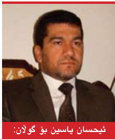
ئیحسان یاسین بۆ گولان:

سیاسەتى نوری مالیکی لەو کاتەوێ بۆتە سەرۆك وەزیرانى عێراق پیاوێ کردنى دوو خالى گرنگە، یەكەمیان پیاوێ کردنى مانۆرى سیاسى و دووھەمیان خۆ دزینەو لەجیبەجێکردنى رێككەوتنەکان، ھەر بۆیە ماوێ نزیكەى سالیكە داوا لەنورى مالیکی دەکریت خۆ دزینەو لەجیبەجێ کردنى رێككەوتنەکان و داخستنى بەبیانوى جۆراو جۆرى بێ بنەما، عێراق و پرۆسە سیاسى کەى رووبەرۆوى قەیرانیكى گەورە دەكاتەو، بەلام لەماوێ ئەم سالەدا نەك ئامادەنەبوو بۆ ئەوێ بەدیالۆگ و كۆبوونەو كێشەكان چارەسەر بکرین، بەلكو چەندین سیناریۆى جۆراو جۆرى دروستکردووە، بەلام ئیستا کە گەیشتۆتە ئەوێ دەزانیت لایەنە سیاسىەکان جددین لەسەر وەرگرتنەوێ متمانە لێی کەوتۆتە بانگێشە بۆ ئەوێ ئامادەپە بەوتووێژ و دیالۆگ كێشەكان چارەسەر بکریت، بەلام پرسىارى گرنگ لێردا ئەوێ ئایا بەشى ئەو متمانە ماو بەدیالۆگ و كۆبوونەو ھەموو كێشەكان چارەسەر بکرین؟ بێگومان وەلامى ئەم پرسیارە ھەلوئىستى ئەو لایەنە سیاسىانە ديارى دەكات کە بچ ئومێدن