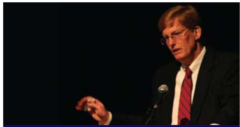
جۇشۇ لاندیز بۇ گولان:

پروپۇفیسور لاندیز وتى: (ھەلۇیستى روسیا كېشەيەكى راستەقینەيە لەبەردەم بارودۇخى سوریا، لەبەر ئەو دى روسیا و چىن سنوورېكیان كېشاو و نایانەوئىت ئەمىرىكا و ئەوروپا حكومەتى سوریا بپووخىنن، پىموايە ھەردولایان ئەمە بەشكست دەزانن لەپووخاندنى حكومەتى سورىادا، كە ھەردولایا بەراستى نىگەرانن لەئاستىدا. كەواتە سوریا بۇتە گۇرېپانى ناكۆكى لەنیوان رۇژئاوا و رۇژھەلاتدا لەسەر رۇژھەلاتى ناوہراست... بەلام پرسىيارى ئەو دى چۆن كارېك بكرېت روسیا پشت لەسوریا بكات، پىموايە تەنیا ئەو كاتە پشتى تىدەكات كە بزانیت چىتر توانای كۆتېرۇلكردنى بارودۇخەكەى نەماو. لەلایەكى دىكەش من لەو پراپاىەدام ئەوروپا نایەوئىت دەستپوهردانى راستەووخۇ بكات، ھەرەھا زۇر گران پراو دەستىت لەسەر ئەمىرىكا ئەگەر بپرىارى دەستپوهردان بدات، ئىمە دەزانن ئەمىرىكا پارە و كاتىكى زۇرى لەعیراقتا بەخەرچدا، ھەرەھا سوریا كېشەيە لەو رووہو، لەو ئاراستەيەو كە ۲۴ ملیون خەلكى تىدایە، ھەرەھا نەوتىكى زۇرى نىيە، لەبەر ئەو دى ئاودەانكردنەو و سەقامگىرکردنى ئەو ولاتە ئەركىكى زۇر قورس ئەگەر پىارە نەبىت، چۆنكە ئەگەر دەستپوهردان بکەيت، ئەوا پارەيەكى زۇر خەرچ دەكەيت. ھەرەھا ئەمىرىكا و ئەوروپا باوهرپان واپە رۇژىمەكەى ئەسەد دەپووخىت و ئەمە كۆتایى حكومرانی عەلەویەكانە، ئەویش لەبەر ئەو دى لەسەدا ۱۲ دانىشتوان پىكدەھىنن، لەبەر ئەو دى لەرووى ئابورىيەو شىكستیان ھىناو، ھەرەھا سزا ئابورىيەكان سورىايان تېكشاندو، ھەرەھا لەبەر ئەو دى ولاتانى كەنداو پارەيەكى زیاتر بەموعارەزە دەدەن بۇ ئەو دى بەھىزتر بن، ئەمەش ھاوسەنگى ھىز دەگۇرېت، واتە ئىستا رۇژئاوا رۇژىمەكە برسى دەكات و خۇراك دەداتە موعارەزە و پىیان واپە لەمەوداى دووردا سوریا دەپووخىت و ئەوان ناچارن نىن ھىچ شىتېك بکەن)).