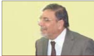
ئەمىن ھادى پەرلەمانتارى دەۋلەتى ياسا: