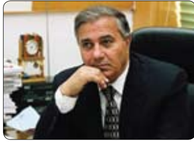
فاروق جویدە نووسەر و شاعیری ناواری میسری:

ھەردوو کانيدکراوھە بە ھەموو ئامرازەکانەوھە بزاف و چالاکیەکانى خويان چر کردۆتەوھە بۇ راکيشانى دەنگدەران چ لە ناو گوندو شارەکانەوھە تا دەگاتە گەرەکە شارستانىەکان و تەنانەت لە ناو خەلکى دەستەبژيرو پەراوئىزخراوھەکانىشەوھە، ھەر يەکیان بە شيوھيەک لە ھەولدايە سەرەنجى خەلکى بۇ پىداويستى مىسر لە ناسايش و سەقامگىرکردنى بارى ئابوورى و سياسى راکيشىت، يەکیيان لە رېي و تارى ھەماسى و ئايىنەوھە سۆزى دەنگدەران دەجولئىت و بۇ پىشتگىرى کردن لە بيرو راکانى پىوانى ئايىنى دواى خۆى خستووھە پرۆژەى نەھزەى راکەياندوھە کە جەخت لەسەر جىبەجى کردنى شەرعیەتى ئىسلامى دەکات ئەوى تریان بە خىتابى عەقلانىيەوھە خۆى وەک دەولەتمەدارئىک نىشان دەدات کە لە توانايداىە کاروبارەکانى دەولەت مەدەنيانە بەرپۆبەرئىت و متمانەى ھەموو عەرەب و جىھانىش بەو شيوھيە بەدەست يىئىت، ھەر يەکەشيان لە ھەولدان ئەو فراکسىۆنانە بە لای خۆدا راکيشن کە لە خولى يەکەمىن دەرپەرئىراوھەتە دەرەوھى راکابەرى کردن.. بە پىچەوانەى راپرسىەکانەوھە کە چاوەرئ دەکران عەمرۆموساو عەبدولموتعمىم عەبدولفتوح