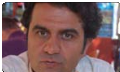
پروفیسۆر کفانج ئۆلۆسو‌ی بۆ گولان:

کاریگه‌ری له‌سه‌ر کورده‌کانی سووریا زیاد بکات بۆ ئەوه‌ی بیانیاریزێ له‌ کاریگه‌ری گروپه‌ توندپه‌وه‌کان و بتوانسێ له‌ داها‌توودا بینه‌ کاره‌کته‌رنکی به‌هێز له‌ داها‌تووی سووریا)). به‌لام پڕۆفیسۆر ئۆلۆسو‌ی به‌ پێچه‌وانه‌ی پڕۆفیسۆر گه‌نج جه‌خت له‌سه‌ر ئەوه‌ ده‌کاته‌وه‌ که بۆچوونی هاوبه‌ش له‌سه‌ر مه‌سه‌له‌ گرنگه‌کان وه‌ک یه‌که‌و له‌مباروه به‌ گولانی راگه‌یاندا: (راسته هه‌رێمی کوردستان و تورکیا هه‌مان بۆچوونیا هه‌یه سه‌بارت به‌وه‌ی ئەسه‌د دیکتاتۆره و پێوسته‌ بروت، به‌لام