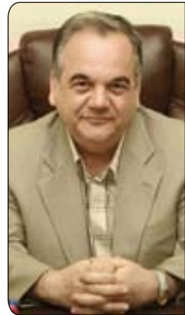
د. ئەنوەر عەبدوللا بەرزنجى

لەم چوارچۆپەدا كارى گرنكى داھاتووى حكومەتى ھەرىمى كوردستان دروستكردنى شەراكتەتەكە لەناو عيترائى يا لە گەل ولاتانى دراوسى، ئاليزەدا كاتىك نيچىرفان بارزانى سەرۆكى حكومەتى ھەرىمى كوردستان باس لە شەراكتەتى نيوان ھەرىمى كوردستان و توركييا وەكو يەكئىك لە ستراتيژىيەكان دەكات، قسەو باسىكى زۆر ھەلدەگریت و، ئەو دوو پرسىيارە ديتتە پيشەو چۆن و بۆچى ئەو شەراكتەتە دروستبكریت ؟ لەكاتىكدا كە