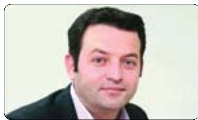
پرۇفيسۆر سەفاچ گەنج بۇ گولان:

بە تەنيا ھەولیدا بەلام ھىچى بەدەست نەھىنا چونكە ئەمە ستراتىژىيەكى ھەلەيە، بەلام ماوئىيەكە دەيىننن توركيە برىسارى داو ھەلگەل ھەريىمى كوردستان بەيەكەو ھەولى چارەسەر بەن ئەمەش ستراتىژىيەكى گونجاو و دروستە و كوردەكانى عىراقىش پىۋىستە لەم بارەيەو درىغى نەكەن و ھاوبەشەن لە سەقامگىر كوردنەوى ناوچەكە چونكە ناسەقامگىرى ناوچەكەى كوردەكانى توركيە ھىچ سوودىكى بۇ كوردەكانى عىراق نىيە يىنگومان. بۇيە من زۆر گەشەيىنم لەم بارەيەو و پىم وايە ھەريىمى