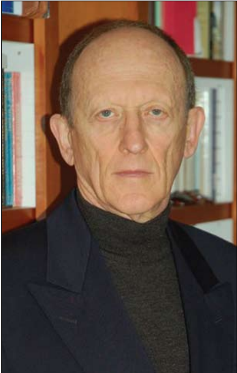
دانيال چىرۆت بۆ گولان:

- موبالەغەكراو لە بارەي ھەلكشانى ھيژى شىعە. پىششىنى كاردانەو توندى سوننە دەكرا، ئەمەش لە بەرژوھەندى سەئودىيەو ئەمەريكىيەكان شكايەو. لە كۆتاييدا، ئەگەرى ئەو ھەيە سەئودىيە و ميسر بىنە ھاوپەيمانى، ھەروھە ئەگەر رۆژى سوريە بروخىت ئەوا زۆرىنە سوننە زالدەبن. ئەمەش دەيىتتەو پەراوئىرخستنى حىزبۆللا، و ھاوكارى كردنى رۆژى مەلەكى ئەردەن. بە دۇنيايىيەو مەحالە پىششىنى ئەو بكرىت كە رۆودەدات، بەلام نايىت ئەوھەمان لە يادبچىت كە ھيژى گەورە شىعە، ئىران، ئابوورىيەكى لاوازی