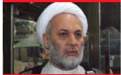
شىيخ جلالەدىن سەئىدى بۇ گولان:

رۇوخاندنى لايەنى بەرامبەر، بۇنمۇنە كاتىك كە مەسەلەى سەندەۋەى مەتمانە لەسەرۆك ۋەزىران خرايەروۋ بەھۇى جىبەجىنەكردىنى رىككەۋەتتەكەى ھەلبۇى، بەلام رىككەۋەتتى ھەلبۇىر خۇى سەفقەبەكە ئەگەر مەتمانە لەسەرۆك ۋەزىران ۋەرىگىرئەتەۋە، ئەۋا ئەمە ماناى ئەۋەيە بەشېك لەرېككەۋەتتەكە بىردرا، لەبەر ئەۋەى بەپىلى رىككەۋەتتى ھەلبۇىر مالىكىيى بوۋە بەسەرۆك ۋەزىران. بۇيە يان دەيىت باسى گۇرپانكارى بەپىئى ئەۋ ماۋەيە بىكەين كە دانراۋە و ماۋەكەى چوار سالە، دەكرىت لەرېگەى سەندۇۋەكانى دەنگدانەۋە سزاي كەسانى كەمتەرخەم بىردىت، راستە ئەزمۇون ھەن كە تىيادا ھۆكۈمەت بۇ سالىك يان دوۋ سال لەژىر تاقىكرىدەۋە بوۋە و ھەلبەتە ھەموۋشمان ئەۋ راستىيە دەزانىن ئەۋ ھۆكۈمەتەى كە پىڭكەتتەرا ھۆكۈمەتى