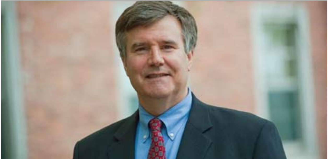
گريگورى گهوس بۇ گولان: