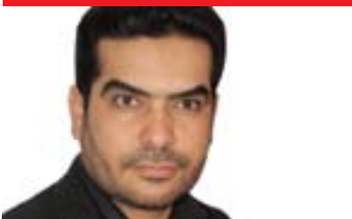
ئەسعد ترکی بۆ گولان:

که ئەمەڕۆ مەرجه عیبەتی ئایینی لە بەردەم ژمارەیهک بژاردنایە لە ڕووی مامەڵەکردنی لە گەڵ گەل و توانا کانی و پیکهاته کانی و هەروەها لە گەڵ سەرکردە سیاسییەکانیش: یەكەم: یان ئەو یە مەرجه عیبەتی ئایینی بە هیچ شێوێک دەستێوەردان لە پڕۆسەی سیاسی و کاروباری گشتی نەکات، ئەمەش لە ڕووی فیکری ئیسلامییەوه دانێنانه بەوێ پیاوانی ئایینی ناتوانن رابەراییەتی مەرۆقاییەتی و کۆمەلگە بکەن و خۆشکردنی بوارە لە بەردەم لایەنەکانی دیکە، بژاردنی دوو مە بریتییە لە دەستنیشتانکردنی ناوینشانیککی سیاسی یە کگرتوو و هەلبەتە ئەمەیش پینگە میژووییەکی دەشیوئینیت، بژاردنی سییەم بریتییە لە لەخۆگرتنی هەمووان لە ژێر ناوینشانی چاودێریی باوکانە بۆ هەمووان و یە کپریزی لە نیتوان