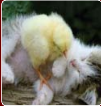
وینه یی حیواو و طالێ هاو بهش